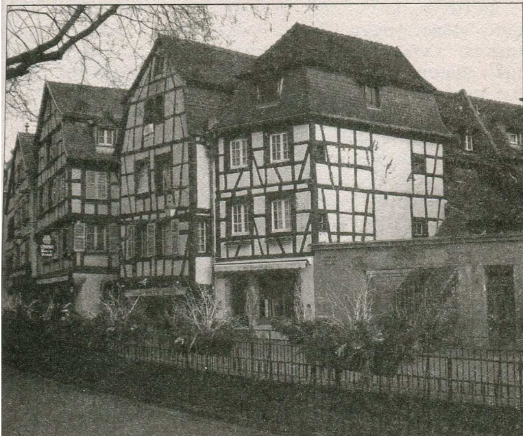
Фахверкова архітектура Кольмара

Регіон Ельзасу має давні архітектурні традиції, пов'язані з особливостями місцевості. Традиційні будинки на Ельзаській рівнині роблять із так званими фахверковими стінами, а дахи вкривають плоскою черепицею.