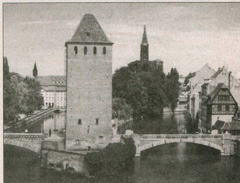
Страсбург. Старе місто

У 1949 р. Страсбург був обраний штабквартирою Ради Європи і на території, що прилягає до парку Оранжерея, розпочалося будівництво. До речі, саме в приміщенні Страсбурзького університету відбулося у 1949 р. засідання Європарламенту. У 1964 р. було збудовано Палац Прав Людини, у 1976 р. Палац Європи, а в 1999 р. – будинок для проведення сесій Європарламенту. Будівля проектувалася у Паризькій студії і віддзеркалює у своїй композиції основні елементи західної цивілізації: класицизм та ба-