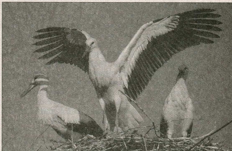
Лелека білий, птах-символ Ельзасу

Сучасні ельзасці спілкуються переважно стандартною французькою мовою, хоча споконвічною в Ельзасі є німецька мова, а серед літніх людей усе ще зберігається ельзаська мова, що належить до алеманської групи німецьких ді-