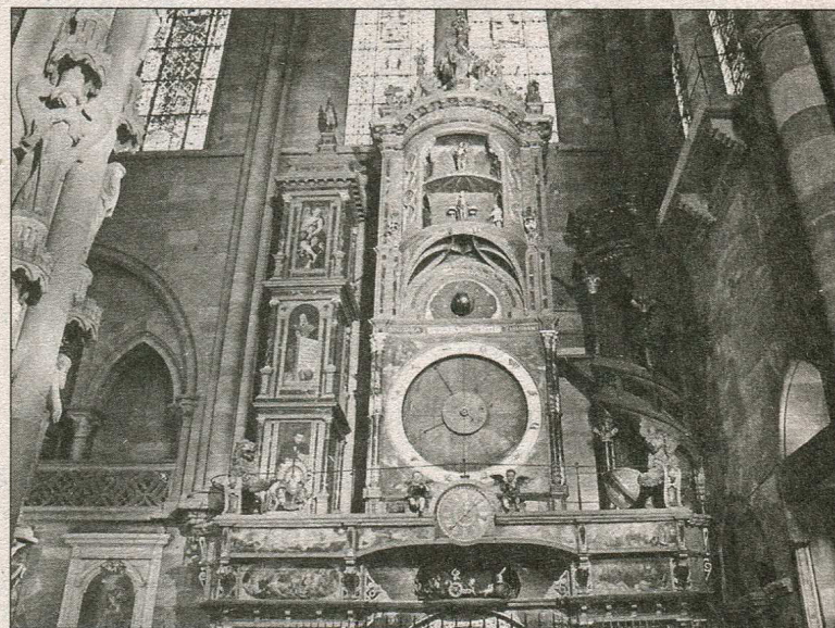
Астрономічний годинник Кафедрального собору Нотр-Дам

Сучасна площа Гутенберга із скульптурою відомого винахідника книжкового друку, що працював у Страсбурзі в період приблизно 1430–1444 рр., колись називалась Маршео-Ерб («Овочевий ринок»). У 1430 р. Йоганн Гутенберг був вигнаний з Майнца і оселився в Страсбурзі, що підтверджують документи кількох судових процесів.