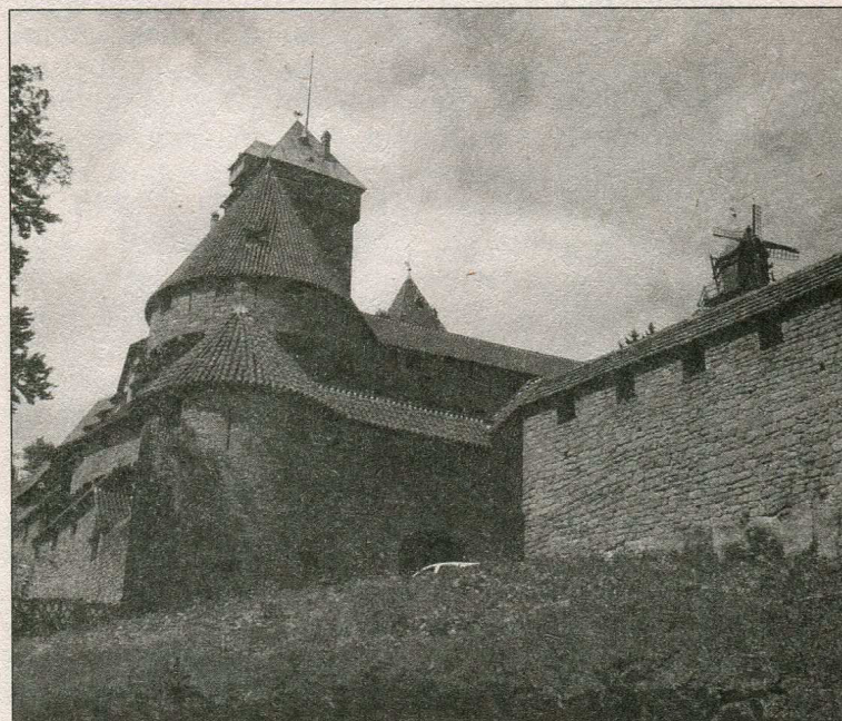
Замок Верхній Кенігсбург

Незважаючи на невеликі розміри території, земля Ельзасу дала світовій культурній і науковій скарбниці чимало яскравих і значних імен.