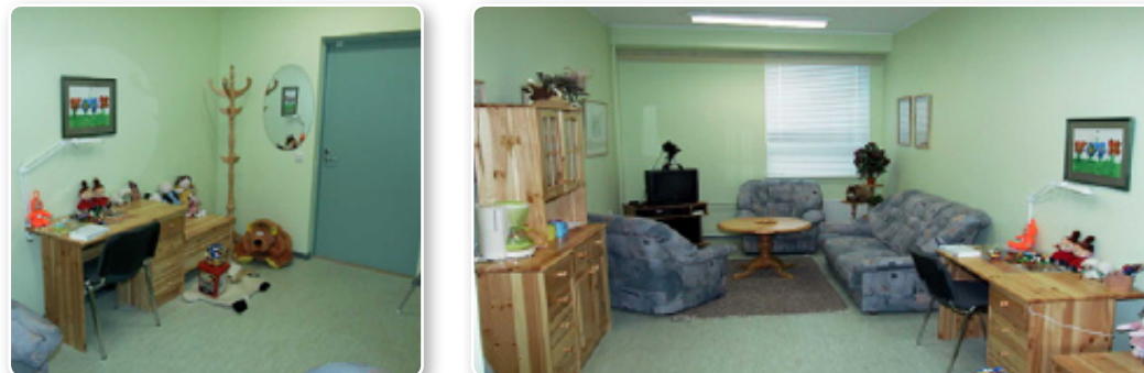
Мал. 1. Кімнати для опитування дітей в Естонії.

для опитування дитини, зокрема, анатомічні ляльки, малюнки, тести, опитувальники. За законодавством Естонії, у допиті дітей до 14 років завжди беруть участь працівники служби допомоги жертвам чи свідкам насильства.