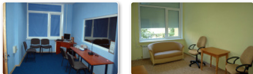
Мал. 2. Дружня кімната до дитини.

Є приклади, коли подібні кімнати розташовані в приміщеннях служби у справах дітей. Так, у Болгарії така кімната була відкрита у 2008 році при центрі надання соціальних послуг у місті Пазарджік. В Україні показовим прикладом може слугувати кімната, обладнана на базі притулку для дітей служби у справах дітей у м. Києві. Відкриття кімнати стало можливим завдяки проекту «Впровадження пілотної моделі структурної профілактики насильства щодо дітей», що впроваджувався Українським фондом «Благополуччя дітей» у партнерстві з Міністерством України у справах сім'ї, молоді та спорту, Київською міською службою у справах дітей, Київським міським центром соціальних служб для сім'ї, дітей та молоді тощо за підтримки міжнародної організації «Brot für die Welt» (Німеччина). Приміщення отримало назву «Дружньої кімнати», облаштоване за відповідними європейськими стандартами та рекомендаціями роботи з дітьми. Організація кімнати (окремі приміщення для опитування та для спостереження за дитиною спеціалістами (співробітники кримінальної міліції у справах дітей, суддями та ін.), віденське дзеркало, система комунікації між кімнатами, відео- та аудіозапису опитування, зручні меблі для дітей і дорослих, іграшки) сприяє створенню комфортної та безпечної атмосфери для дитини.