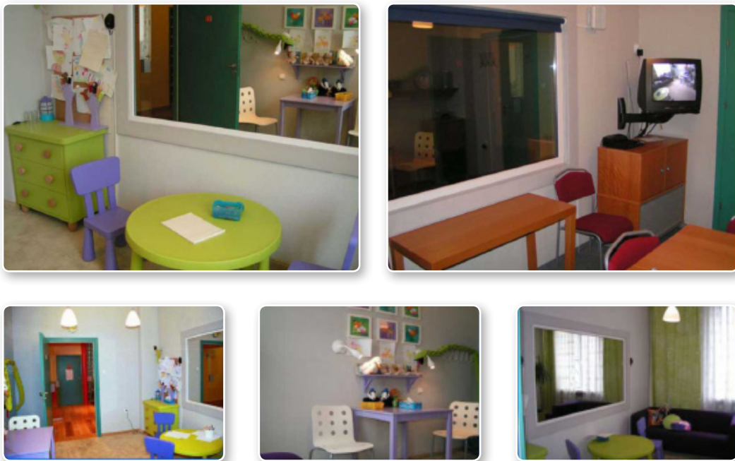
Мал. 3. Кімната для опитування дітей в Центрі захисту дітей "Mazowiecka" (Фундація «Нічії діти», Польща)

У низці країн спеціальні кімнати для опитування дітей працюють на базі неурядових організацій. Наприклад, у Молдові для опитування дітей використовується кімната на базі неурядової організації «Ла Страда-Молдова», а в Польщі – при благодійному фонді «Нічії діти», а також на базі соціальних служб та Центру захисту дітей (мал. 3).