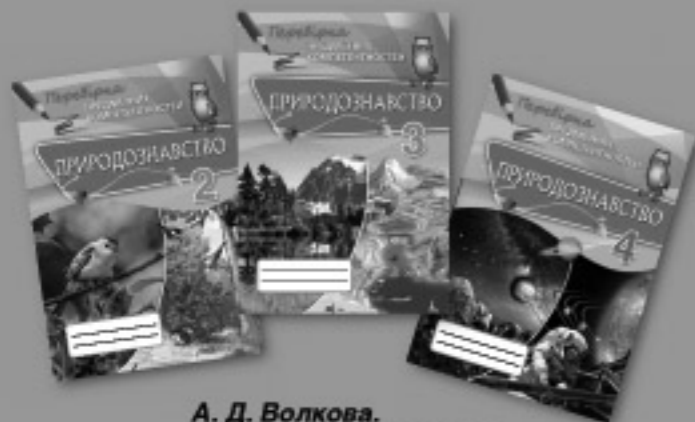
А. Д. Волкова. Перевірка предметних компетентностей. ПРИРОДОЗНАВСТВО (2–4 класи)