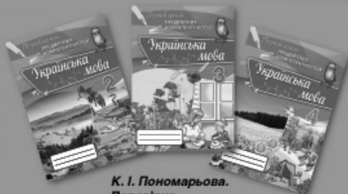
К. І. Пономарьова. Перевірка предметних компетентностей. УКРАЇНСЬКА МОВА (2–4 класи)

в практиці вітчизняної освіти пропонуємо новий — компетентісно орієнтований підхід до перевірки навчальних досягнень учнів початкової школи з української мови, математики, природознавства й інформатики.