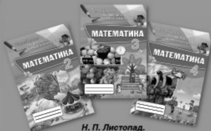
Н. П. Листопад. Перевірка предметних компетентностей. МАТЕМАТИКА (2–4 класи)