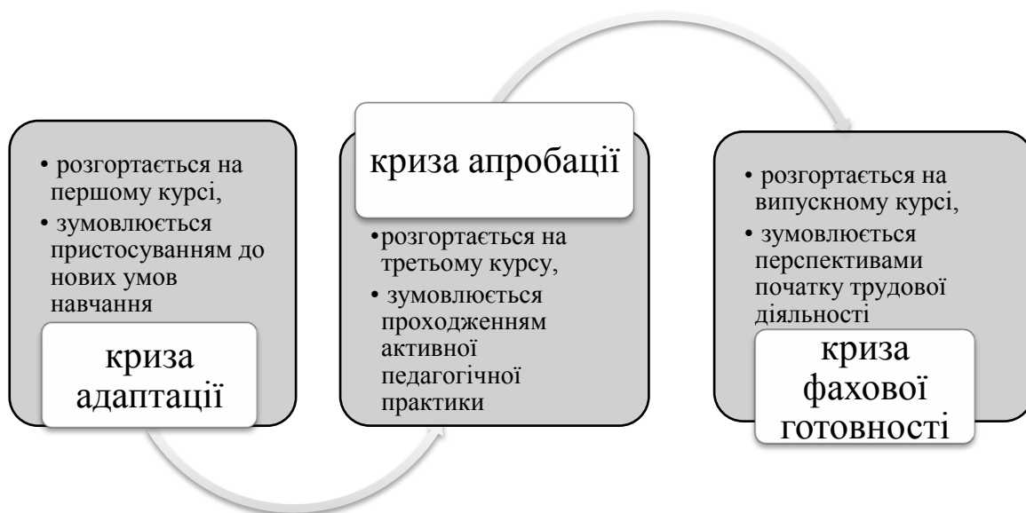
Рис. 3. Кризи фахового навчання майбутніх педагогів

Більш предметне формування професійної самооцінки майбутнього вчителя розгортається під час фахового навчання. На ранніх етапах оволодіння професією самооцінка майбутнього фахівця піддається впливу частини криз професійного становлення, яку ми виокремимо і позначимо як кризи фахового навчання. Можна чітко виділити наступні кризи в професійному навчанні майбутнього вчителя: