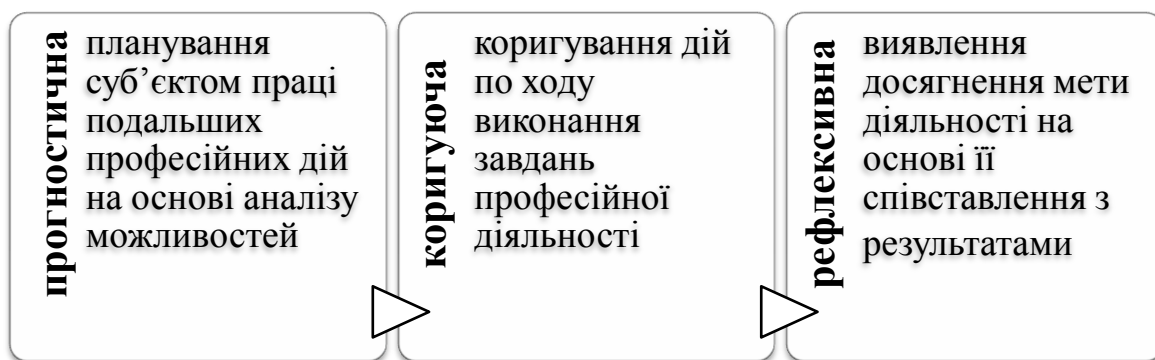
Рис.1 Функції самооцінки суб'єктом праці професійної діяльності

Професійна самооцінка вчителя є набутиим в процесі професіоналізації надбанням його особистості, результатом оцінювання суб'єктом праці самого себе як фахівця, своїх педагогічних можливостей, професійних якостей і місця в професійному середовищі [4, 7]. Професійна самооцінка, як різновид загальної самооцінки особистості поєднує в собі когнітивний, афективний та поведінковий аспекти. Так, в процесі самооцінювання вчитель дізнається, чи відповідають його особистісні якості, рівень компетентності, результати діяльності стандартам педагогічної праці. Внаслідок цього формується ставлення до себе як суб'єкта праці та вибудовується подальший рівень домагань, бажаних досягнень щодо професійної діяльності. Оскільки мова йде про самооцінку фахівця як суб'єкта професійної діяльності, то в процесі самооцінювання фігурують три її функції: