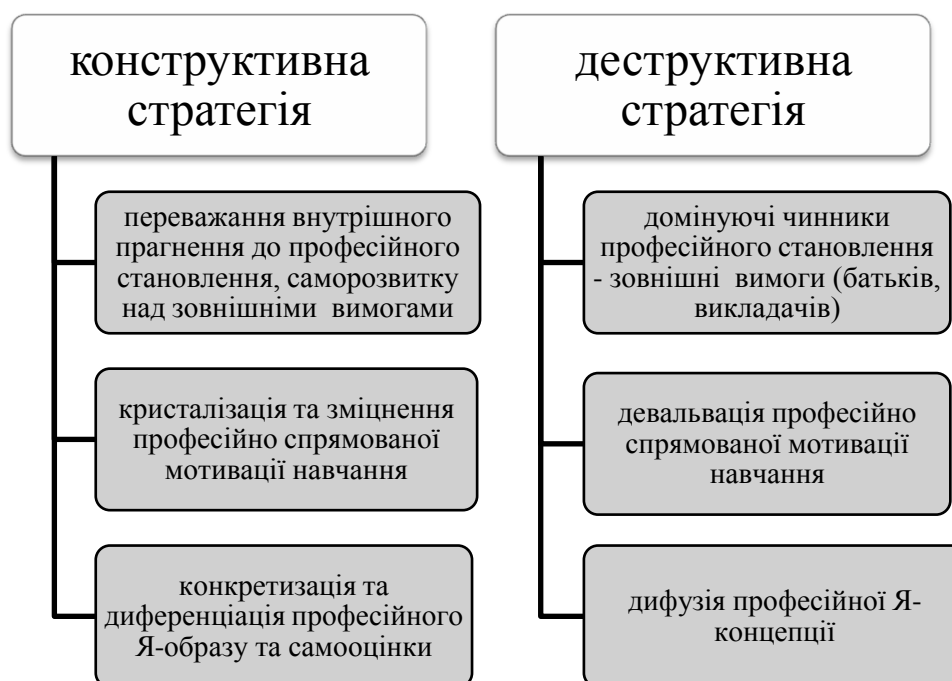
Рис. 4. Зміст конструктивної та деструктивної стратегій подолання криз фахового навчання

Вище охарактеризовані кризи фахового навчання можуть долатись за умов використання студентом однієї з двох базових стратегій: