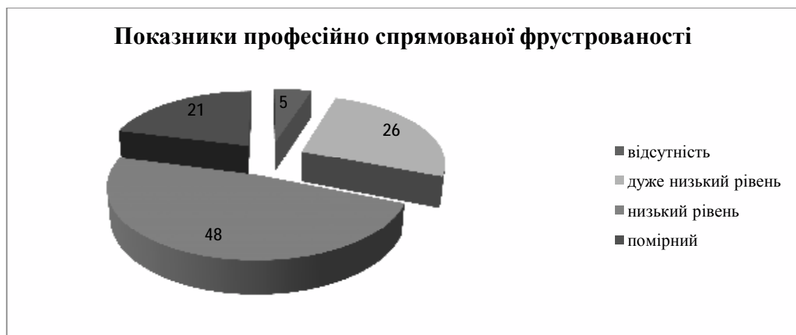
Рис. 1. Розподіл даних за рівнем проф. спрямованої фрустрованості

Середнє значення показників професійно спрямованої фрустрованості майже збігається з середнім показником особистісної фрустрованості (1,75 у.о. до 1,70 у.о.), однак розподіл за рівнями дещо різниться, оскільки є більше носіїв помірною та високою рівня особистісної фрустрованості (рис. 3 та 4).