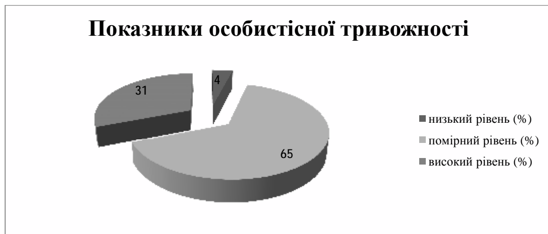
Рис. 2. Розподіл рівнів особистісної тривожності

Недостатньо сприятливо для успішної самореалізації опитаних виглядає картина виявлення рівня їх особистісної тривожності, оскільки щодо більше третини студентів – 31 % – вона є високою (рис. 2):