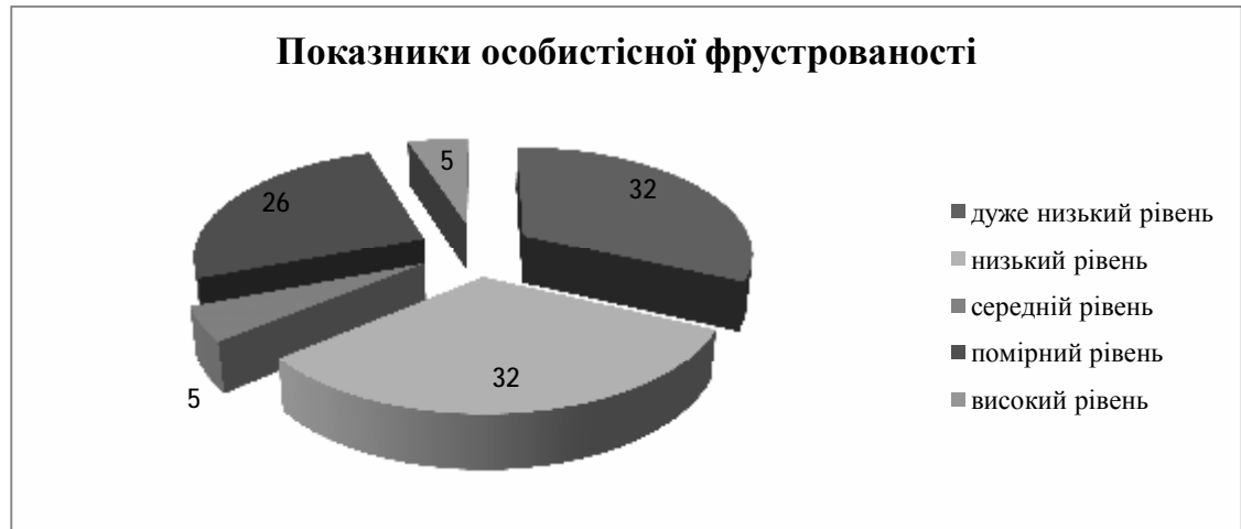
Рис. 2. Розподіл даних за рівнем особистісної фрустрованості

Отже, тридцять один відсоток опитаних студентів може виявляти деструктивну конфліктність на підставі високих показників фрустрованості особистісної та професійно спрямованої сфер. Однак, при дослідженні зв'язків між фрустрованістю та тривожністю й агресивністю було виявлено наявність як прямої, так і зворотної кореляції. Зокрема, кореляція Пірсона щодо професійно спрямованої фрустрованості та агресивності має зворотний характер ( -0,320^* ), а щодо тривожності зафіксовано прямий зв'язок ( 0,348^* ). Це означає, що зростання рівня професійно спрямованої фрустрації тягне за собою підвищення тривожності особистості та зменшення її агресивності.