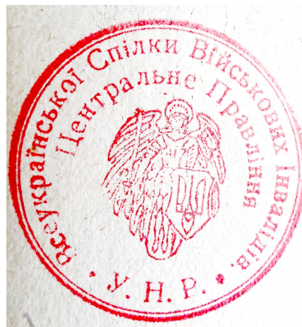
Іл. 1. Відтиск печатки Всеукраїнської спілки військових інвалідів УНР, Тарнів (Польща), 1922 р. (Центральний державний архів вищих органів влади та правління України, ф.1075, оп.2, спр.822)