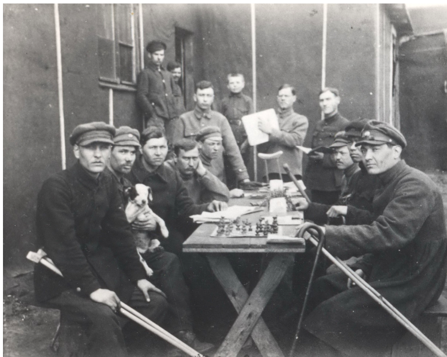
Іл. 3. Група інвалідів Армії УНР, інтернованих у таборі Каліш, Польща, 1921 р. (оригінал зберігається в: Архів ОУН при Українській інформаційній службі (УІС) в Лондоні, ф.30, оп.3, од.зб.17, од.обл.1)