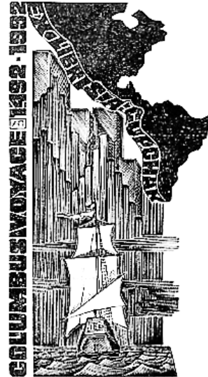
Рис. 1. А. Пугачевський «Мандри Колумба». 1992 р.

уватися значно важче. Вони є представниками двох різних генерацій, різних манер виконання, стилі яких сформувались в руслі взаємовпливу. Важливо відмітити і те, що індивідуальний стиль представника старшого покоління, мабуть, в більшості схильний впливу молодшого художника – серед робіт батька помітний вплив сина.