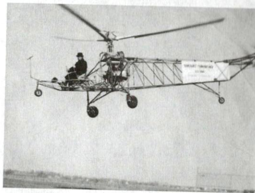
▲ Сікорський вперше піднімає у повітря гелікоптер VS-300, 1939

І. Сікорський відомий як авіаконструктор. Проте мало хто знає про інші його зацікавлення. Релігійно-філософські праці Сікорського були опубліковані в часи найбільших потрясень, а саме у роки II Світової війни. І дуже влучно характеризують цивілізацію та суспільний уклад XX ст. Найпопулярнішою вважають його невелику книжку «Послання молитви Господньої» (1941), у якій автор наступним чином оцінює світ: «Сучасна цивілізація в особі більшості її впливових діячів або прямо відкидає Христа, або ввічливо не звертає на Нього уваги, у той же час приймаючи переважну частину тих принци-