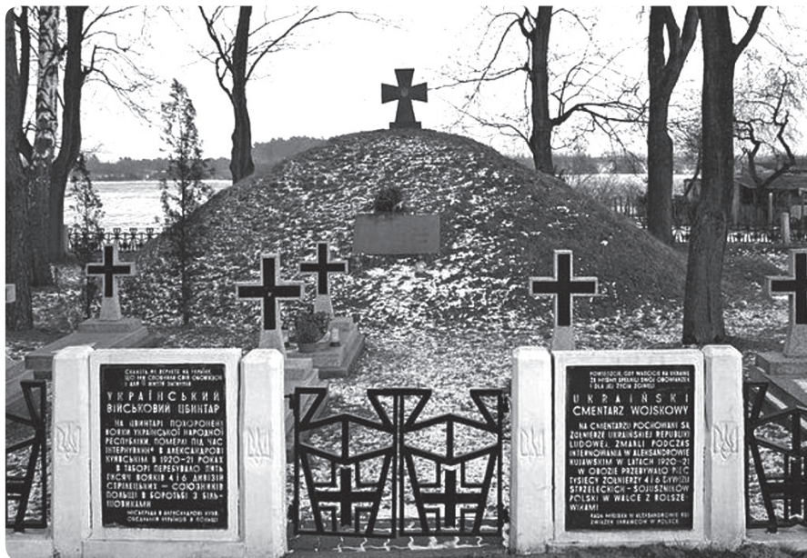
Козацька могила (сучасний вигляд)

(Нове життя. – Александрово, 1921. – 22 вересня. – Ч.83).