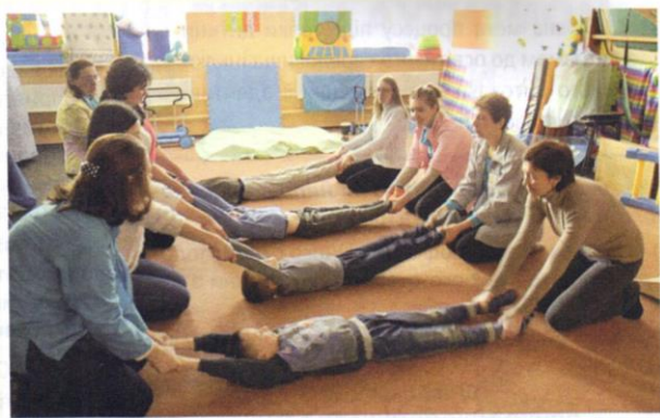
Вправа “Перевертання на підлозі”