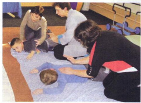
Приєм проплескування по м'язах.

Малюка необхідно "зібрати", "натренувати", розкрити його ресурси, у прямому сенсі цього слова "поставити на ноги" — зробити так, щоб ноги набули функцію опори для тіла. Тільки тоді розвиватимуться такі якості, як витривалість, довільність, уважність, цілеспрямованість, здатність продуктивно навчатися й розвиватися разом з однолітками.