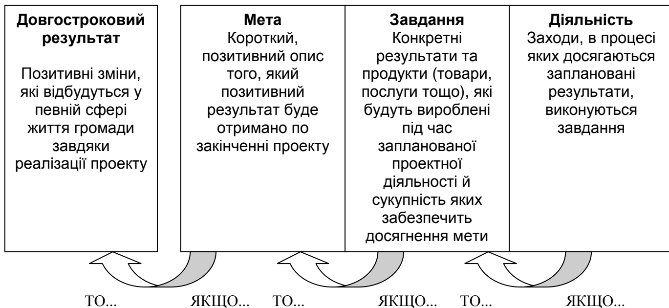
Рис. 1 Логіка побудови проекту

Узагальнену логіку побудови проекту та її перевірку в зворотньому порядку можна представити у вигляді наступної схеми.