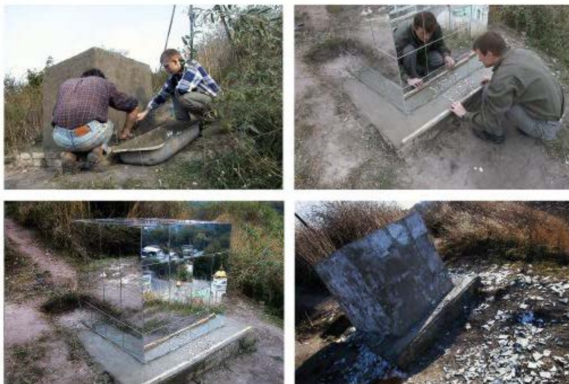
Рисунок 1. «Станция-1», кирпич, зеркальные плитки, 108x108x108 см, гора Замковая, г. Киев