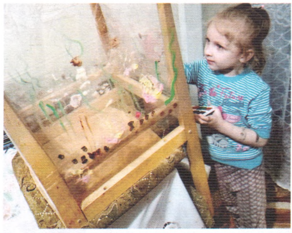
Я тільки пензлем провела — й на плівці квітка розцвіла!