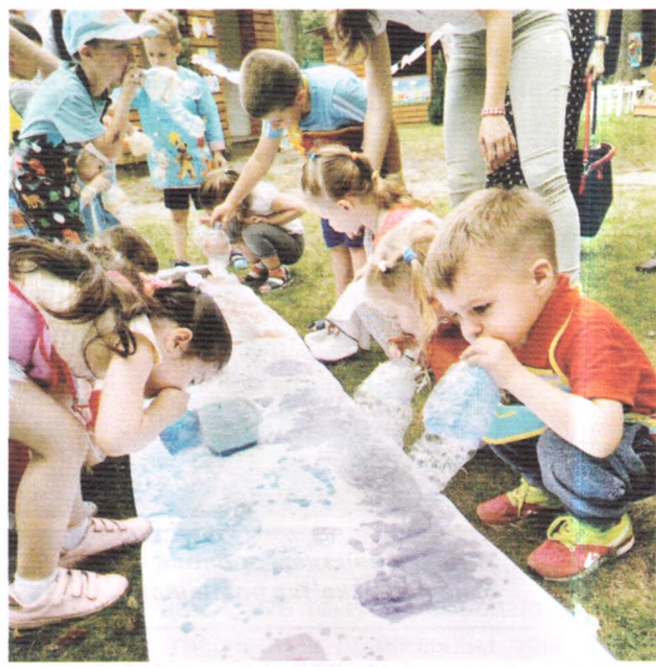
Сідають бульбашки на полотно — І враз неначе ожива воно

Наприклад, вихователь заходить до групової кімнати з розкритою парасолькою. Такий прийом