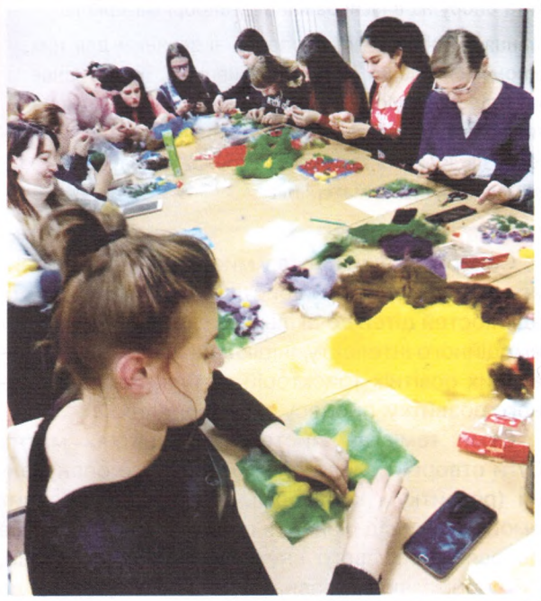
У творчості граней багато: Вчимося із вовни валяти.

По-друге, розвиток творчих здібностей відбувається ефективніше за умови комплексної активізації всіх каналів сприймання : візуального, аудіального, кінестетичного.