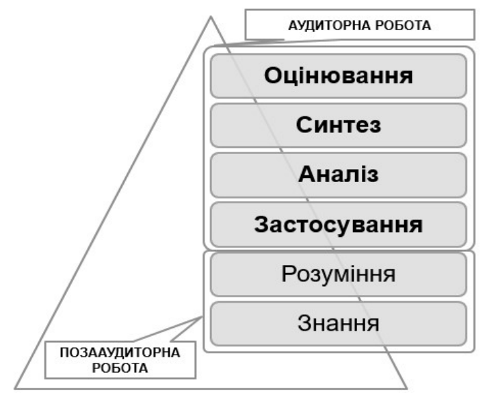
Рис. 3. Використання перевернутого навчання та таксономія Блума

Для ефективного використання відео-матеріалів під проектування електронного навчального курсу розглянемо детальніше освітню мету застосування технології перевернутого навчання (рис.3.), яка може базуватися на таксономії Блума [6], модифікованій Андерсоном та Кратволем [1]. Відповідно до цієї таксономії існує шість рівнів когнітивних здобутків: знання, розуміння, застосування, аналіз, синтез і оцінювання. У перевернутому навчанні те, що студенти виконують в рамках позааудиторної роботи, належить до знань і розуміння, тобто до нижчих рівнів когнітивного навчання, адже відеоматеріали використовуються для ознайомлення студентів з базовим матеріалом. Під час проведення аудиторних занять формуються навички вищих рівнів когнітивного мислення, такі як аналіз, синтез та оцінювання [8]. Роль викладача в аудиторії змінюється — він стає ведучим, застосовує дискусії, організовує спільну навчальну діяльність, групову роботу, проекти, сприяє розвитку у студентів здатності до саморефлексії.