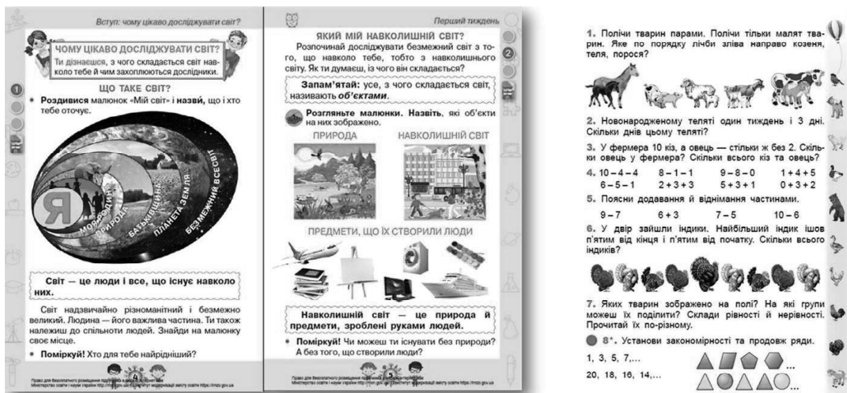
Рисунок 5 – Візуальні елементи

5. Сторінки перевантажені візуальними елементами, які ускладнюють сприйняття основного тексту першокласниками (рис. 5).