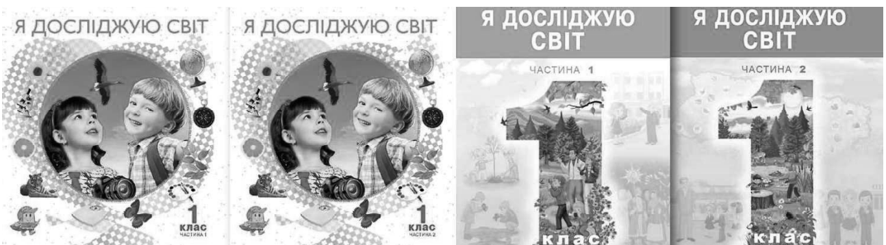
Рисунок 2 – Ідентичне оформлення

2. Дві частини підручника мають ідентичне оформлення. Якщо підручник випущено у двох частинах варто виконувати кожен частину в єдиному стилі, але з різними зображувальними чи декоративними елементами. Порівняймо оформлення обкладинок на рис. 2. У прикладі справа перша і друга частини підручників об'єднані спільною композицією, проте мають різну кольорову гаму та різні зображення, що сприяє успішному орієнтуванню учнів у навчальному матеріалі, мотивує переходити до наступної частини в процесі навчання.