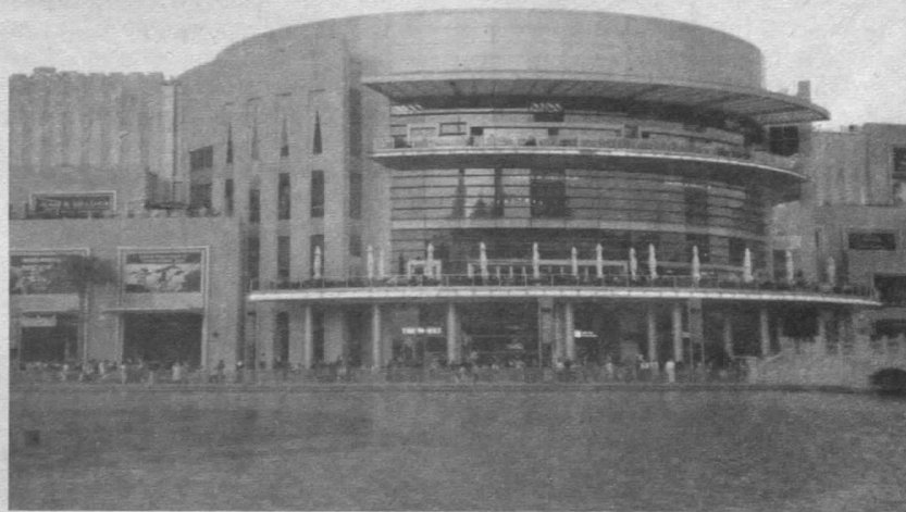
Найбільший торговельний центр планети «Дубай Мол»

Нині крім нафти і газу в ОАЕ добувають хроміти, виплавляють сталь, переробляють свинець, мідний брухт, виробляють каустичну соду, хлор, сіль, цемент. Крім того, в країні представлено практично всі основні промислові підприємства, що працюють як на власній, так і на імпортній сировині: виробництво будівельних матеріалів, готового одягу, продуктів харчування і напоїв, тканин, виробів зі шкіри тощо. У Дубай діє алюмінієвий завод, що імпортує глинозем з Австралії.