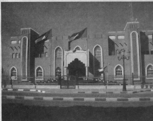
Гімназія для хлопчиків у Фуджейрі

Тепер аббревіатура ОАЕ звучить дуже гордо. На них зважають усі країни світу, дехто просто «спить і бачить», як би повторити те ж саме. Однак це лише здається, що їм все легко вдалося. Насправді ж у цьому криється вікова традиція. Наприклад, у Дубаї кожен мешканець емірату може прийти на прийом до шейха і той вислухає його, бо шейх – це «батько» народу, він відповідає за своїх «дітей» перед Аллахом. Державну пенсію отримує тільки той, хто перебуває на державній службі, а бути державним службовцем може лише громадянин країни. Якщо держслужбовець виконує свої обов'язки на до-