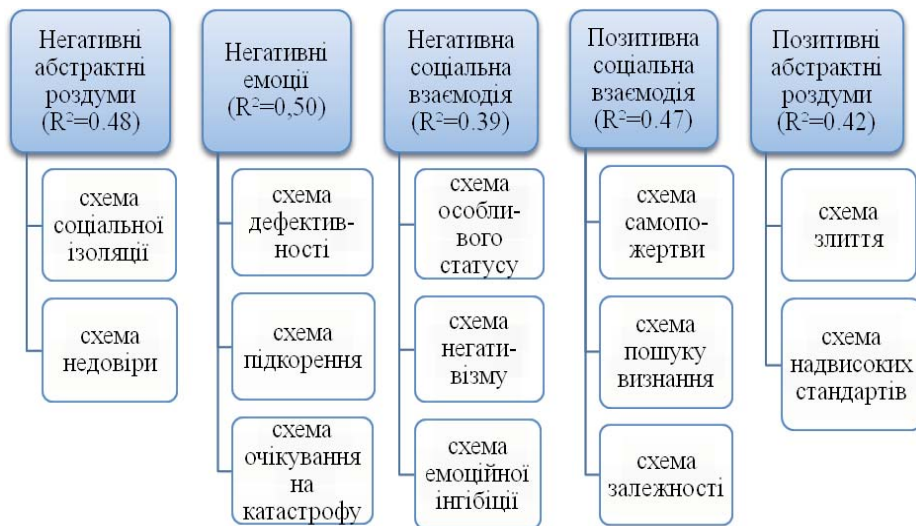
Рис. 1. Прогностичний потенціал нарративних індикаторів для передбачення окремих дисфункційних когнітивних схем

з негативними переживанням та почуттями, з великою мірою вірогідності можна припустити, що йому притаманна одна із зазначених схем. Специфікацію та визначення конкретних глибинних переконань особи, при цьому, краще проводити за допомогою індивідуального структурованого клінічного інтерв'ю, оскільки саме цей метод здатен забезпечити збір якісних ідеографічних даних, на основі яких можна планувати подальші психологічні втручання.