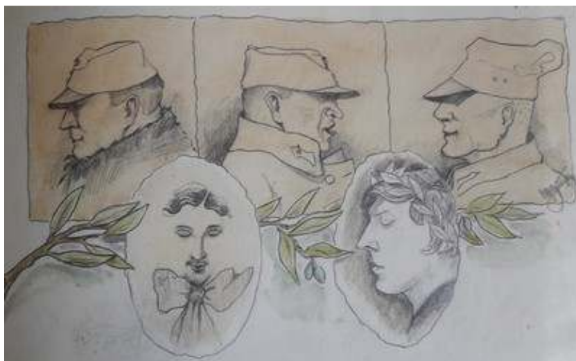
Іл. 17. Три профілі полонених (згори), малюнок олівцем, лютий 1919 р. Див.: Лязароні: сатирично-гумористичний додаток до журналу «Полонений». Кассіно, 1919. 10 лютого. Ч.2. (без посторінкової пагінації)