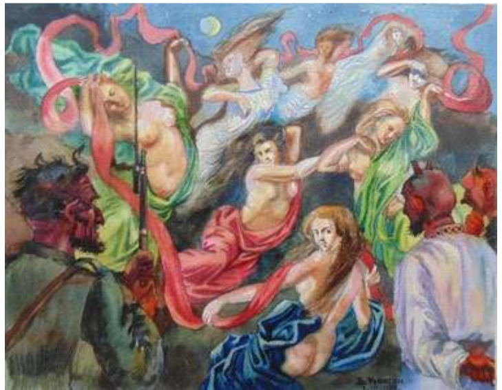
Іл. 35. Жінки у пеклі (малюнок В.Касіяна, уміщений в присвяченому Т.Шевченкові номері журналу «Полонений»), березень 1920 р. Див.: Полонений. Кассіно, 1920. 9 березня. Ч.3(12).