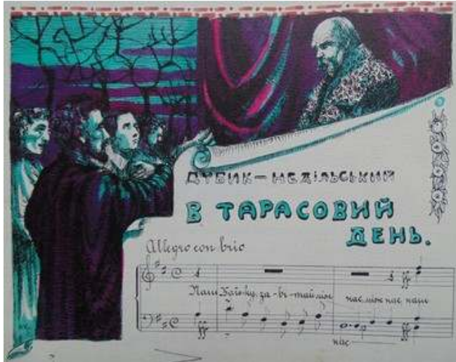
Іл. 37. Малюнок В.Касіяна до нот музичного твору Дубик-Недільського «В Тарасовий день», уміщений в присвяченому Т.Шевченкові номері журналу «Полонений»), березень 1920 р. Див.: Полонений. Кассіно, 1920. 9 березня. Ч.3(12).