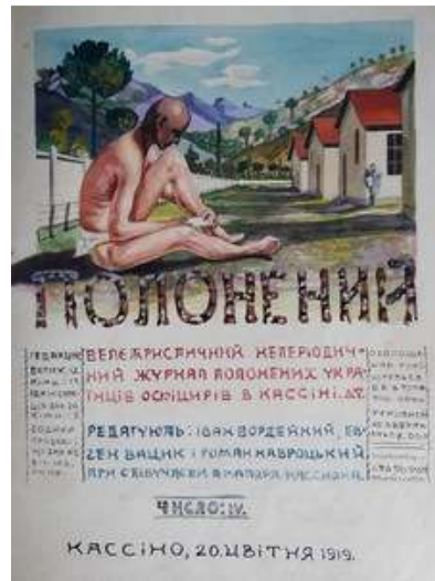
Іл. 23. Обкладинка 4-го номеру журналу «Полонений», квітень 1919 р. Див.: Полонений. Кассіно, 1919. 20 квітня. Ч.4.