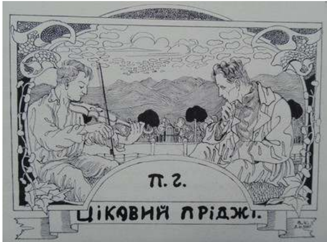
Іл. 40. Малюнок-заставка В.Касіяна до нариса «Цікавий Пріджі», уміщений в присвяченому Т.Шевченкові номері журналу «Полонений», березень 1920 р. Див.: Полонений. Кассіно, 1920. 9 березня. Ч.3(12).