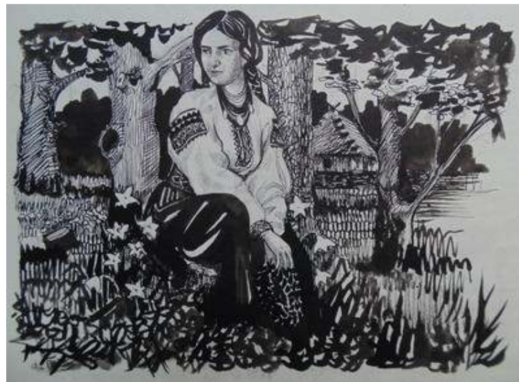
Іл. 25. Малюнок до віршу А.Годованського «Зраджена», січень 1919 р. Див.: Полонений. Кассіно, 1919. 25 січня. Ч.1. (без посторінкової пагінації).