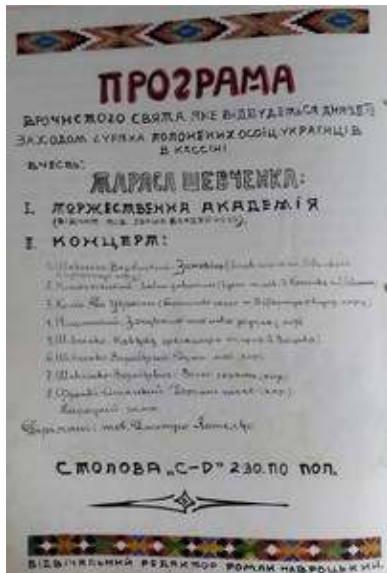
Іл. 30. Програма «Врочистого свята» з нагоди Шевченкового дня в таборі Кассіно, березень 1919 р. Див.: Полонений. Кассіно, 1919. 9 березня. Ч.3. (без посторінкової пагінації).