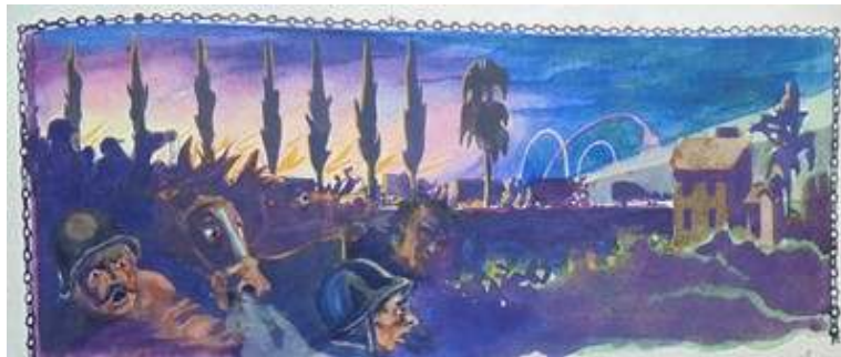
Іл. 9. Кольоровий малюнок до статті Гр-гуна «Авта», березень 1919 р. Див.: Полонений. Кассіно, 1919. 9 березня. Ч.3. (без посторінкової пагінації).