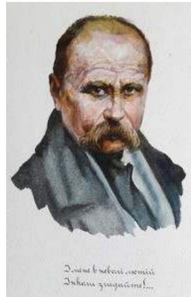
Іл. 33. Т.Шевченко (малюнок В.Касіяна) на першій сторінці 3(12) номеру журналу «Полонений», присвяченого Кобзареві, березень 1920 р. Див.: Полонений. Кассіно, 1920. 9 березня. Ч.3(12).