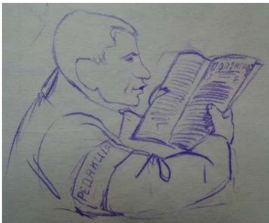
Іл. 13. Профіль полоненого, малюнок олівцем, січень 1919 р. Див.: Лязароні: сатирично-гумористичний додаток до журналу «Полонений». Кассіно, 1919. 25 січня. Ч.1. (без посторінкової пагінації).