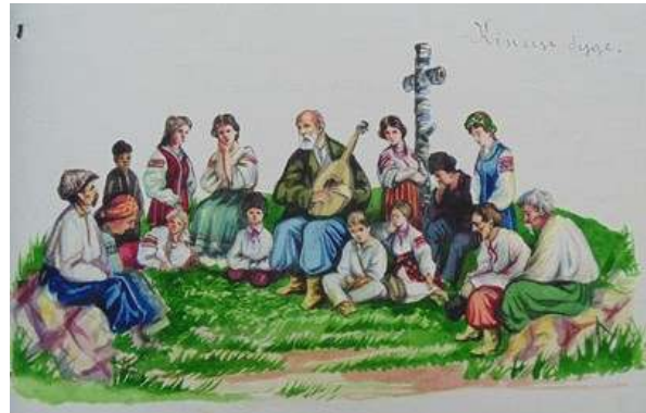
Іл. 31. Малюнок з 3-го номеру журналу «Полонений», присвяченого Кобзареві, березень 1919 р. Див.: Полонений. Кассіно, 1919. 9 березня. Ч.3. (без посторінкової пагінації).