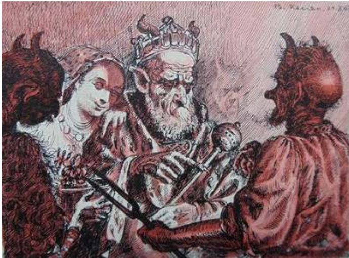
Іл. 34. У пеклі (малюнок В.Касіяна, уміщений в присвяченому Т.Шевченкові номері журналу «Полонений»), березень 1920 р. Див.: Полонений. Кассіно, 1920. 9 березня. Ч.3(12).