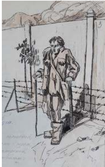
Іл. 11. Збірний алегоричний образ полоненого в таборі біля муру (малюнок до вірша Кирила Тойсамого «Туга»), вересень 1919 р. Див.: Полонений. Кассіно, 1919. 10 вересня. Ч.6-7. (без посторінкової пагінації).