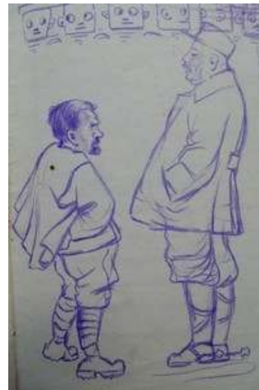
Іл. 14. Полонений (ліворуч) і офіцер таборової комендатури (праворуч), малюнок олівцем, січень 1919 р. Див.: там само.