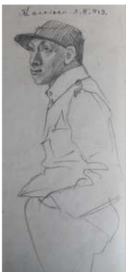
Іл. 15. Полонений в кашкеті, малюнок олівцем, лютий 1919 р. Див.: Лязароні: сатирично-гумористичний додаток до журналу «Полонений». Кассіно, 1919. 10 лютого. Ч.2. (без посторінкової пагінації).