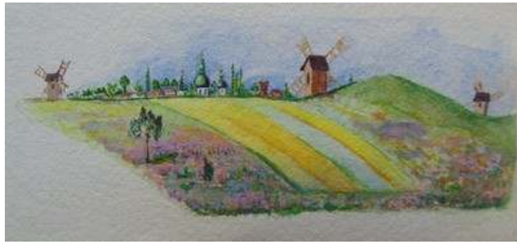
Іл. 8. Кольоровий малюнок до вірша Кирила Тойсамого «Дмитрови Котелкови», червень 1919 р. Див.: Полонений. Кассіно, 1919. 1 червня. Ч.5. (без посторінкової пагінації).