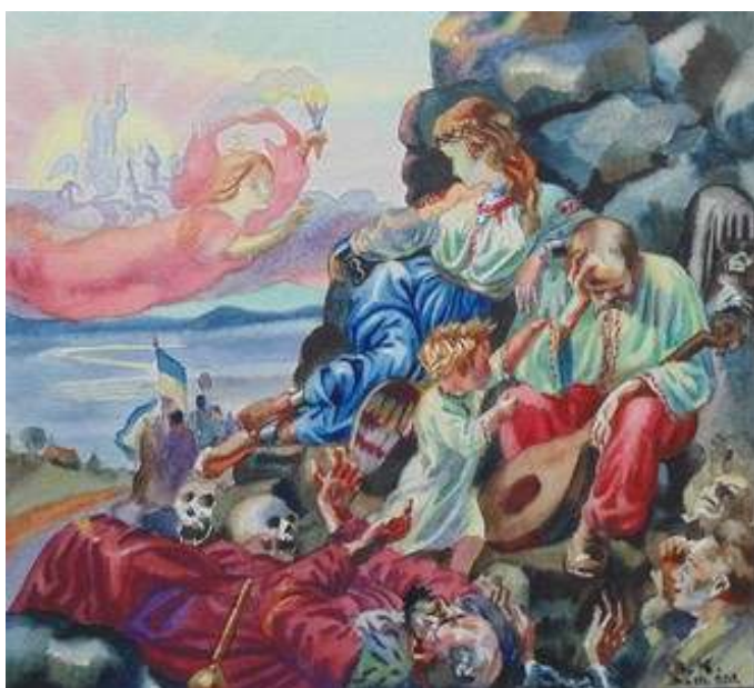
Іл. 36. Воскресіння України (алегоричний образ), (малюнок В.Касіяна, уміщений в присвяченому Т.Шевченкові номері журналу «Полонений»), березень 1920 р. Див.: Полонений. Кассіно, 1920. 9 березня. Ч.3(12).