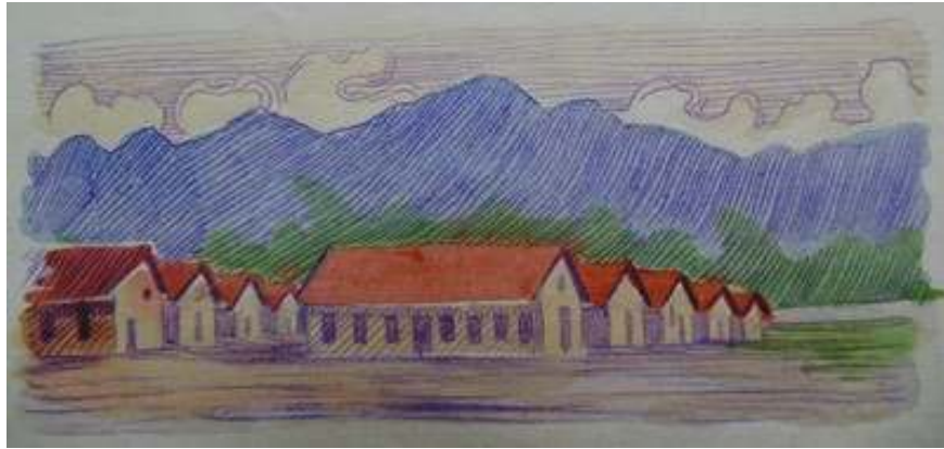
Іл. 1. Загальний вигляд табору Кассіно (кінцева заставка до статті «Від редакції», січень 1919 р.). Див.: Полонений: неперіодичний белетристичний журнал полонених українців в Кассині. Кассіно, 1919. 25 січня. Ч.1. С.2.