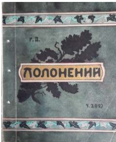
Іл. 32. Обкладинка 3(12) номеру журналу «Полонений», присвяченого Кобзареві, березень 1920 р. Див.: Полонений. Кассіно, 1920. 9 березня. Ч.3(12).