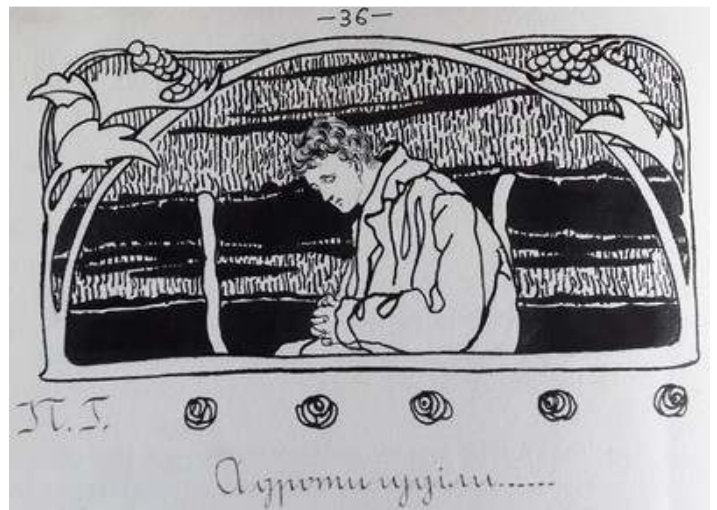
Іл. 38. Малюнок-заставка В.Касіяна до нарису «А дроти гуділи...», уміщений в присвяченому Т.Шевченкові номері журналу «Полонений»), березень 1920 р. Див.: Полонений. Кассіно, 1920. 9 березня. Ч.3(12).