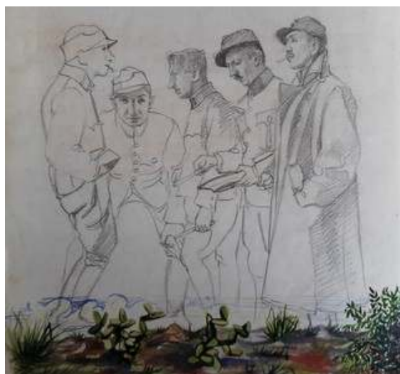
Іл. 16. Група полонених, малюнок олівцем, лютий 1919 р. Див.: Лязароні: сатирично-гумористичний додаток до журналу «Полонений». Кассіно, 1919. 10 лютого. Ч.2. (без посторінкової пагінації).