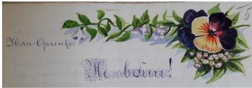
Іл. 26. Кольорова заставка до віршу Івана Орленка «Не вбий», січень 1919 р. Див.: Полонений. Кассіно, 1919. 25 січня. Ч.1. (без посторінкової пагінації).