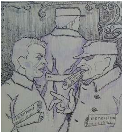
Іл. 20. Полонені старшини-українці з таборовими часописами, малюнок до статті червень 1919 р. Див.: Лязароні: сатирично-гумористичний додаток до журналу «Полонений». Кассіно, 1919. 1 червня. Ч.5.