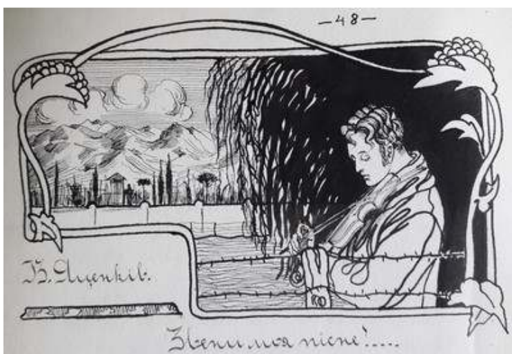
Іл. 39. Малюнок-заставка В.Касіяна до нарису В.Яценкова «Звени моя пісню!...», уміщений в присвяченому Т.Шевченкові номері журналу «Полонений»), березень 1920 р. Див.: Полонений. Кассіно, 1920. 9 березня. Ч.3(12).