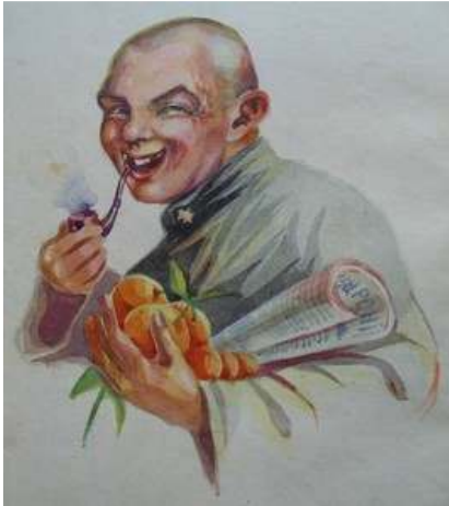
Іл. 18. Полонений з люлькою та апельсинами, кольоровий малюнок, березень 1919 р. Див.: Лязароні: сатирично-гумористичний додаток до журналу «Полонений». Кассіно, 1919. 9 березня. Ч.3. (без посторінкової пагінації).