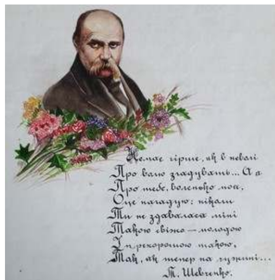
Іл. 29. Т.Шевченко (малюнок В.Касіяна) на першій сторінці 3-го номеру журналу «Полонений», присвяченого Кобзареві, березень 1919 р. Див.: Полонений. Кассіно, 1919. 9 березня. Ч.3.