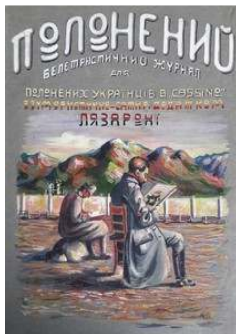
Іл. 4. Полонені старшини за читанням журналу «Полонений» (обкладинка 1-го номеру журналу «Полонений», оформлення