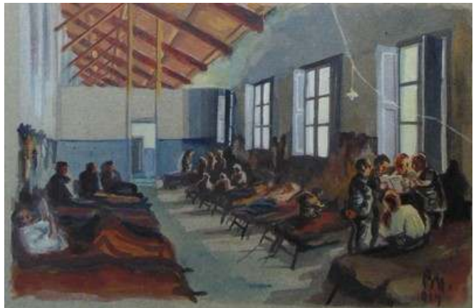
Іл. 3. Внутрішній інтер'єр старшинського бараку (фрагмент обкладинки 5-го номеру журналу «Полонений», малюнок В.Касіяна), червень 1919