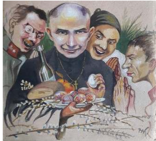
Іл. 19. Великдень в таборі, фрагмент обкладинки 4-го номеру журналу «Лязароні». Див.: Лязароні: сатирично-гумористичний додаток до журналу «Полонений». Кассіно, 1919. 20 квітня. Ч.4.