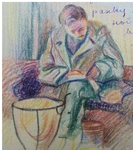
Іл. 10. Кольоровий малюнок до статті Observer-а «Полонений про "Полоненого"», лютий 1919 р. Див.: Полонений. Кассіно, 1919. 10 лютого. Ч.2. (без посторінкової пагінації).