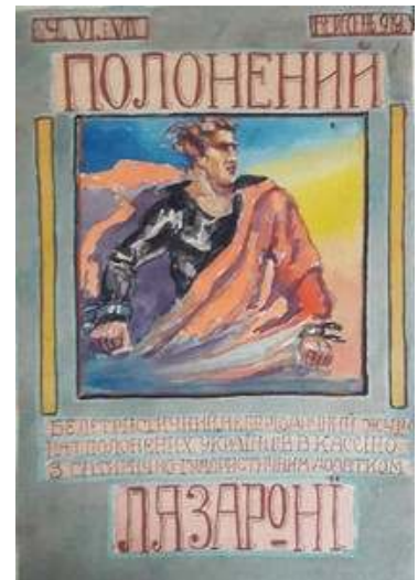
Іл. 24. Обкладинка 6/7-го номеру журналу «Полонений», вересень 1919 р. Див.: Полонений. Кассіно, 1919. 10 вересня. Ч.6-7.