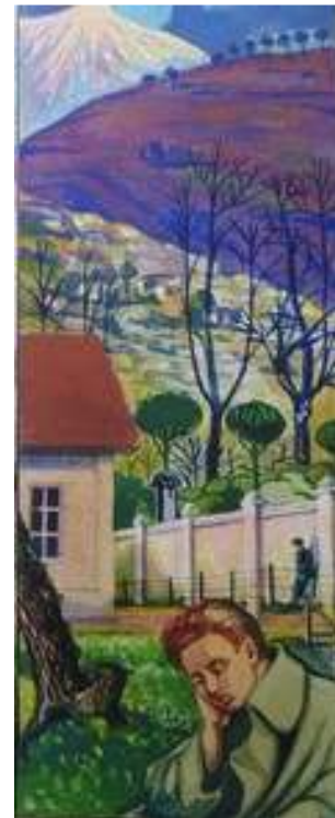
Іл. 7. Кольорова заставка до вірша «До...», березень 1919 р. Див.: Полонений. Кассіно, 1919. 9 березня. Ч.3. (без посторінкової пагінації). Ч.4(13). С.13.