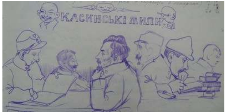
Іл. 12. Профілі полонених, малюнок олівцем, січень 1919 р. Див.: Лязароні: сатирично-гумористичний додаток до журналу «Полонений». Кассіно, 1919. 25 січня. Ч.1. (без посторінкової пагінації).