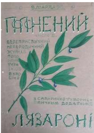
Іл. 28. Обкладинка 3-го номеру журналу «Полонений», присвяченого Кобзареві, березень 1919 р. Див.: Полонений. Кассіно, 1919. 9 березня. Ч.3.