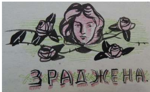
Іл. 27. Малюнок до віршу А.Годованського «Зраджена», січень 1919 р. Див.: Полонений. Кассіно, 1919. 25 січня. Ч.1. (без посторінкової пагінації).