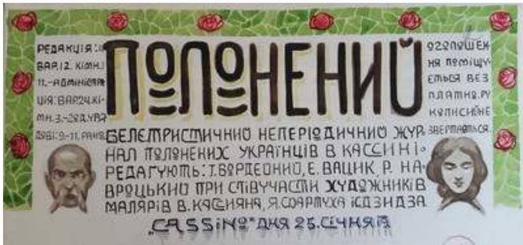
Іл. 5. Заставка до першої сторінки 1-го номеру журналу «Полонений», січень 1919 р. Див.: Полонений. Кассіно, 1919. 25 січня. Ч.1. С.1.С.13.