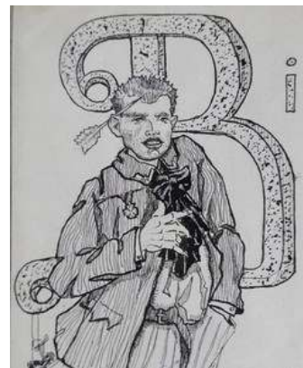
Іл. 21. Малюнок полоненого до статті «Від редакції кілька слів», вересень 1919 р. Див.: Полонений. Кассіно, 1919. 1 червня. Ч.5. (без посторінкової пагінації).