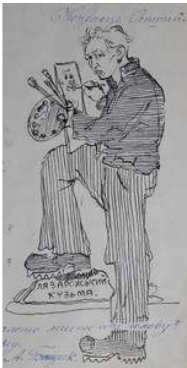
Іл. 6. Художник Василь Касіян за роботою (малюнок-шарж В.Касіяна до статті «Гранатні відломки»), червень 1919 р. Див.: Лязароні: сатирично-гумористичний додаток до журналу «Полонений». Кассіно, 1919. 1 червня. Ч.5. (без посторінкової пагінації). Ч.4(13). С.13.