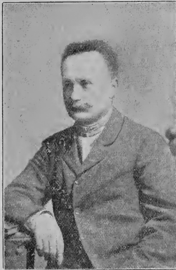
Іван Франко (1856—1916).

Нині можемо сказати, що куди б ти не повернув ся в нашу минавшину за останніх 40 літ, всюди стрінеш ся з іменем Д-ра Івана Франка, всюди він приложив свою добру руку, всюди оставив трівки сліди в науці нашої, у письменстві, в журналістці, в суспільно-економічній праці, в політиці, в парламентаризмі, в театрі, одним словом всюди. Село, город, рілля,