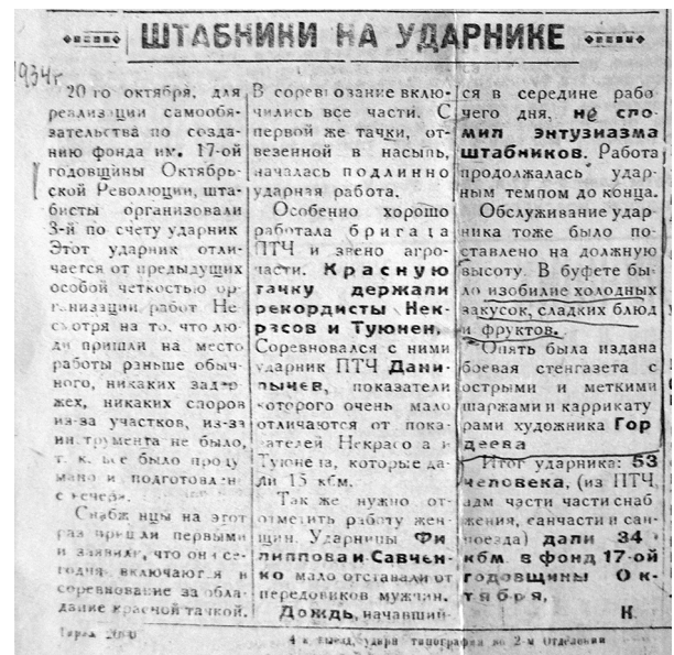
Рис. 2. Газета-бюлетень «Строитель БАМа». (ЦДАМЛМУ. Ф. 208. Оп. 2. Спр. 243. Арк. 23 зв.)

роботи на «ударнику» для ліквідації «прориву» перед святом більшовицької революції відобразились у газеті-бюлетені «Строитель БАМа» (рис. 2).