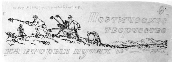
Рис. 4. Заставки Д. Гордєєва до збірок віршів табірних поетів. (ЦДАМЛМУ. Ф. 208. Оп. 2. Спр. 19. Арк. 6.)

Щоправда, інколи тематика художніх робіт (оформлення статей) була і більш приємною. Як-от, у номері за 10 лютого 1937 р. було розміщено заставки Д. Гордєєва та стаття до ювілею О. Пушкіна 13 . Він же оформлював заставки до збірок віршів табірників «Книжкова полиця», «Пісня якутських бійців» і «Вірші табірників» 14 (рис. 4).