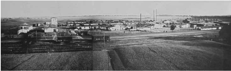
Obóz internowanych żołnierzy Armii URL w Kaliszu (widok ogólny), 1922 r. Ukraińska Stanica w Kaliszu (Polska): kolekcja zdjęć Rity Deszko (USA), Biblioteka Ukraińska im. Symona Petlury w Paryżu, 29.1.P-1

Staraniem ukraińskich władz wojskowych i polskiej administracji obozu zorganizowano dostęp do opieki medycznej, którą kozakom i oficerom zapewniał szpital obozowy