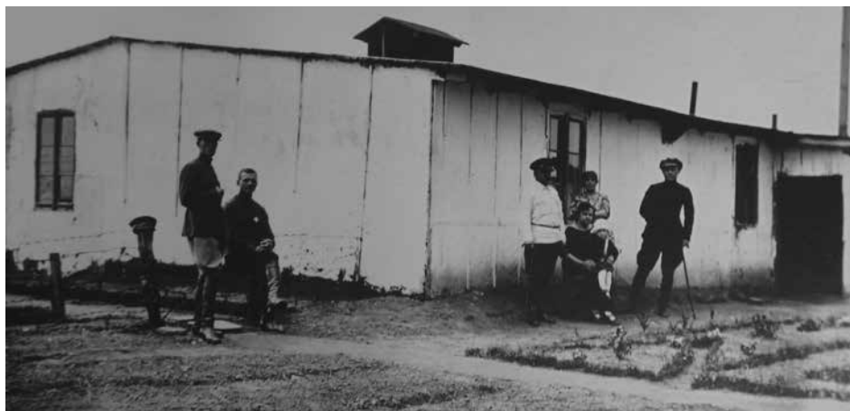
Internowani żołnierze przed jednym z budynków koszar, Kalisz, 1924 r. Ukraińska Stanica w Kaliszu (Polska): kolekcja zdjęć Rity Deszko (USA), Biblioteka Ukraińska im. Symona Petlury w Paryżu, 29.1.P-6

Kolejnym ważnym kryterium jakości życia internowanych był poziom zaopatrzenia ich w żywność. Od samego początku istnienia obozu wszystkie surowe produkty dostarczano bezpośrednio do obozowej kuchni, gdzie potrawy były przyrządzane przez ukraińskich kucharzy. Nieznany autor „Raportu”, który jadł cztery razy w Kaliszu obozowy obiad, podał, że składał się on z talerza „zupy fasolowej z ziemniakami, mięsem, burakami i świeżą kapustą”, przy czym „jedna porcja zawierała około dwóch talerzy zupy”.