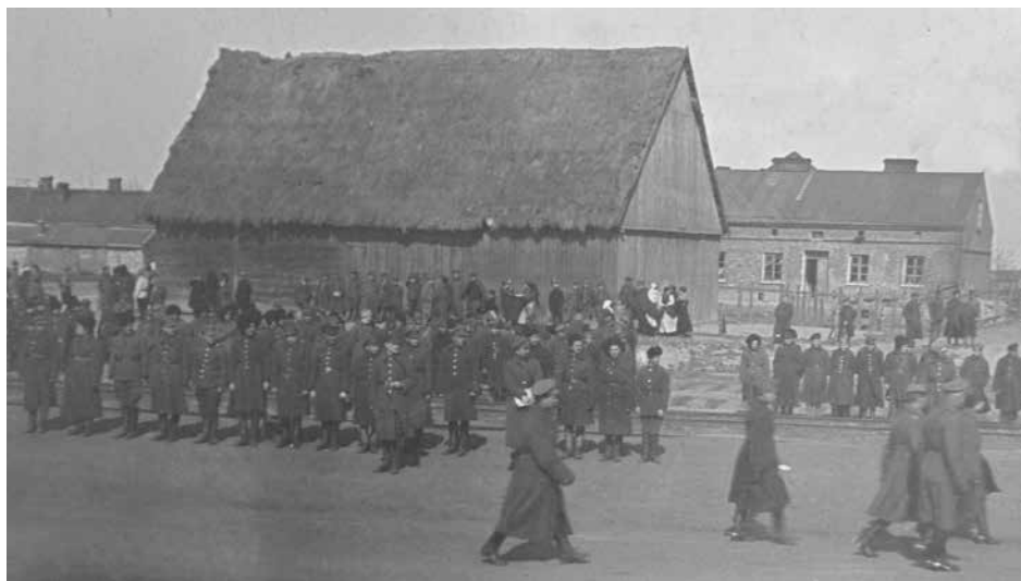
Oddziały ukraińskie w Kaliszu, b.d. Ukraińska Stanica w Kaliszu (Polska): kolekcja zdjęć Rity Deszko (USA), Biblioteka Ukraińska im. Symona Petlury w Paryżu, 29.1.P-2