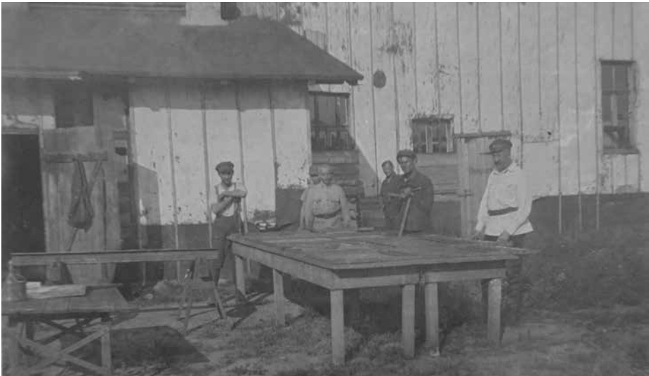
Ukraińscy żołnierze przed budynkiem warsztatów, Kalisz, 1924–1925. Ukraińska Stanica w Kaliszu (Polska): kolekcja zdjęć Rity Deszko (USA), Biblioteka Ukraińska im. Symona Petlury w Paryżu, 29.1.P-37

Wiosną 1922 r. polskie władze kontynuowały politykę zatrudniania internowanych do prac rolnych w prywatnych gospodarstwach oraz do prac pomocniczych w polskich jednostkach wojskowych i instytucjach publicznych. Z mieszkańców obozów tworzone oddziały robocze (zespoły), które zazwyczaj zachowywały swoją organizację wojskową. Dowództwo Armii URL robiło wszystko, by te zespoły oraz ci członkowie oddziałów,