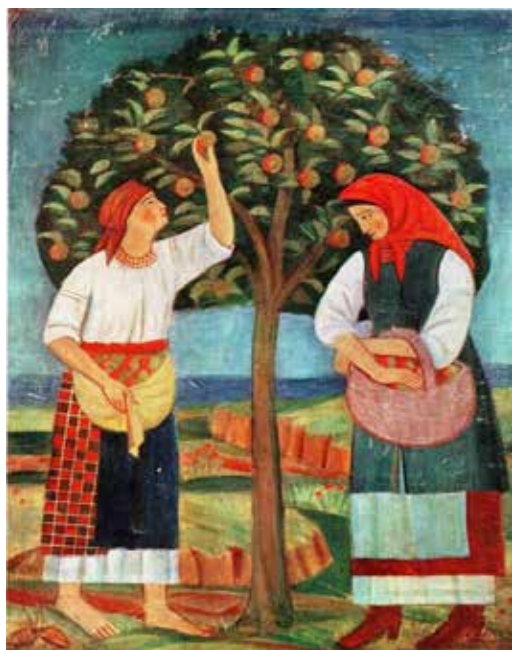
Рис. 1. Т. Бойчук. Жінки біля яблуні. Розпис у Луцьких казармах (1919–1920 роки)

Так, у фресках «Гуляй, душа, без кунтуша», «Застілля», «З оранки», «Різка хліба» тощо митці транслювали простодушну наївність, що є характерною для творів народного мистецтва й полягала у суто народному сприйманні та відчутті селянського життя, характеру та побуту, що стали провідними темами у творах бойчукістів (Білокін, 2017).