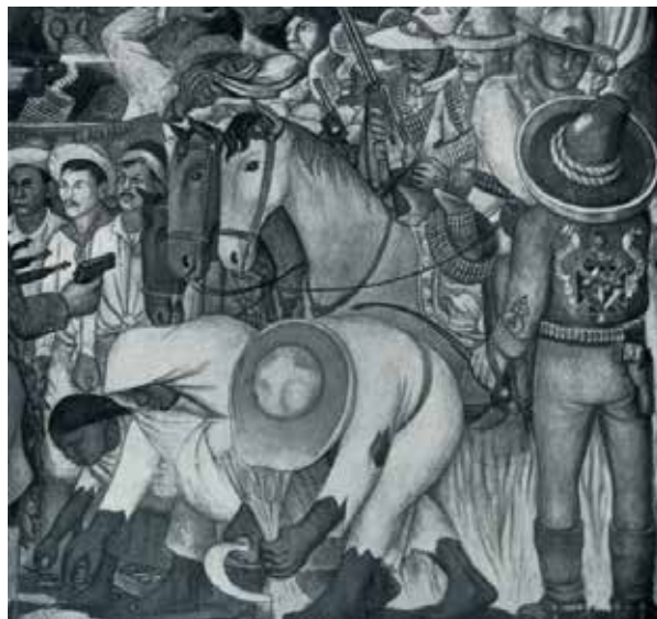
Рис. 5. Д. Рівера. Розписи Національної сільськогосподарської школи в Чапінго, Мексика (1926–1927 роки)

та Національної сільськогосподарської школи в Чапінго (1926–1927 роки), а М. Бойчук – у фресках Селянського санаторію ім. ВУЦВК (Хаджибейський лиман, Одеса) (рис. 4, 5) (Загаєцька, 2010).