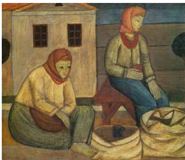
Рис. 2. Т. Бойчук. Селянська біда. Розпис у Луцьких казармах (1919–1920 роки)

Однак у часи великої індустріалізації на всій території СРСР протягом 1920–1930 років, де панувала значна прерогатива міста над селом і російської культури над українською, це розуміння мистецтва не отримало підтримки владних структур.