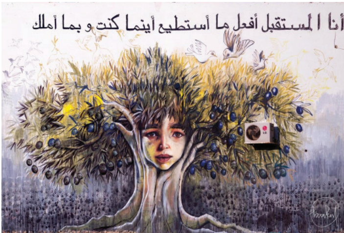
Рис. 6. Herakut. Я роблю все, що можу, де я є, і з тим що у мене є. 2017.

«Я роблю все, що можу, де я є, і з тим що у мене є» – такий особливий заклик несе стінопис у м. Мафрак, що є спільною роботою художника Herakut і місцевих дітей. Гасло цінувати своє і бути там де ти є, розвиватись і жити у тому що є, місцева молодь присвячує всім жителям даних територій (рис. 6) [4].