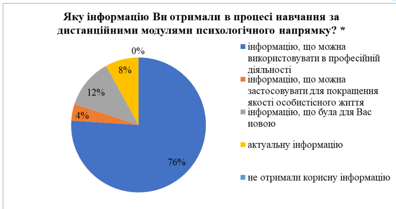
Малюнок 3 - Дослідження інформаційних уподобань слухачів курсів підвищення кваліфікації.