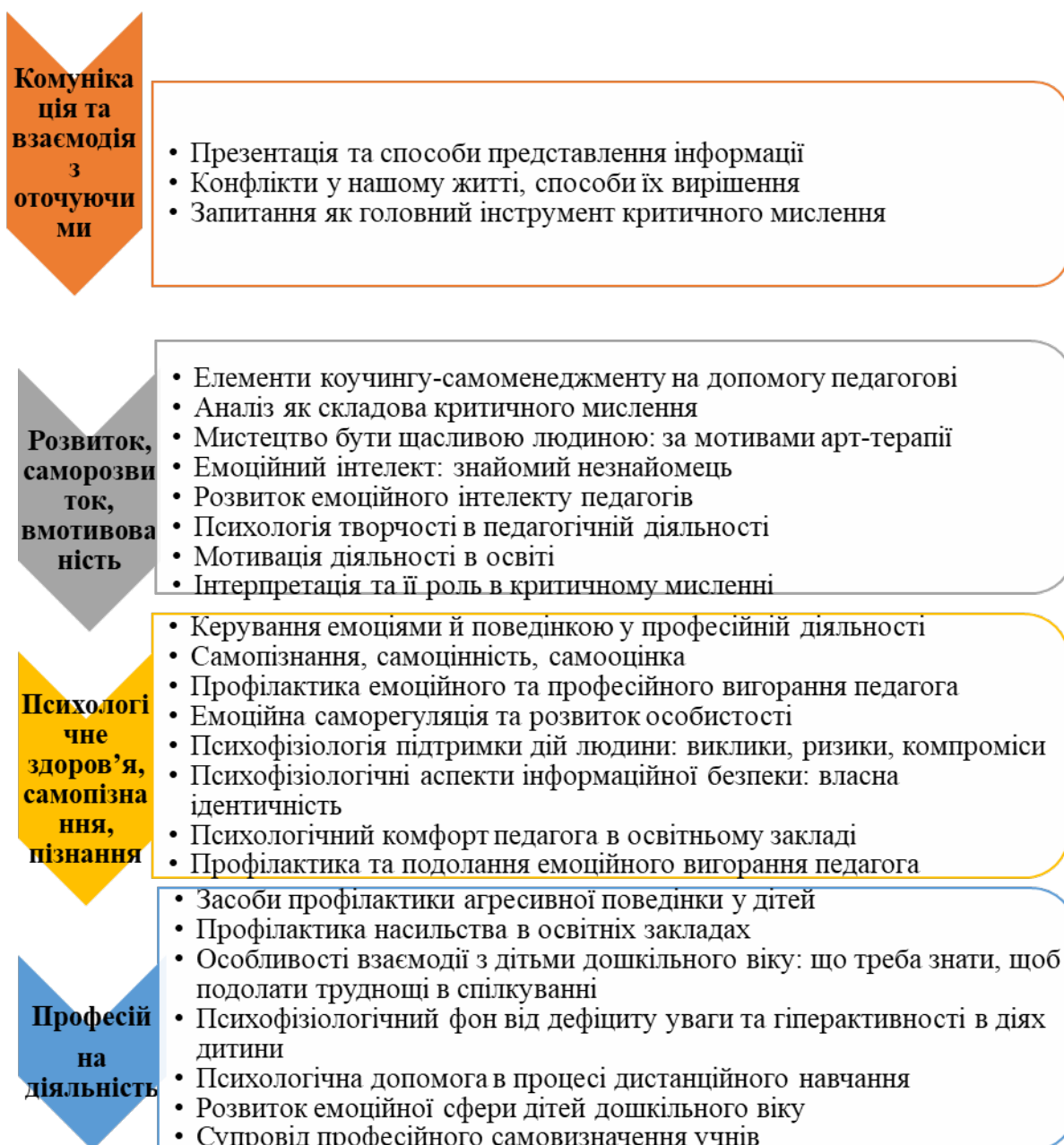
Малюнок 1 - Схема диференціації навчальних дистанційних модулів.

Враховуючи різноплановість тематики навчальних модулів дистанційного навчання, ми продиференціювали наявні навчальні модулі шляхом об'єднання їх у блоки враховуючи напрямки психологічної просвіти. (малюнок 1)