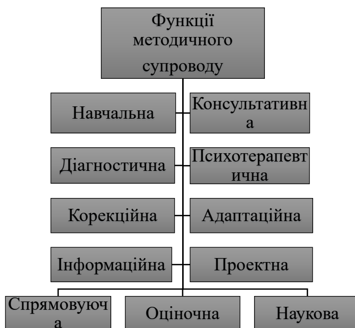
Рис.2. Функції методичного супроводу

– наукова функція надає наукову підтримку педагогам і керівникам методичних служб щодо організації та проведення дослідно-експериментальної роботи, експертної оцінки авторських програм, посібників, навчальних планів, здійснює редакційно-видавничу діяльність [5, с. 329 – 333]. Рис2.