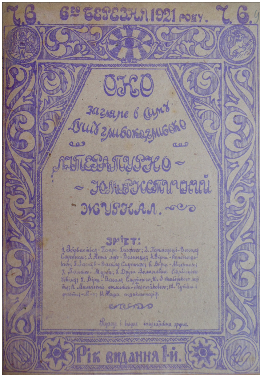
Мал. 1. Титульна сторінка таборового літературно-гумористичного машинописного тижневика «Око» (ч.6 від 6 березня 1921 р.), який видавався заходами культурно-освітнього відділу 2-ої Волинської стрілецької дивізії Армії УНР у таборі Каліш в 1921 р. (ЦДАВО України, ф. 3525, оп. 1, спр. 14, арк. 10)