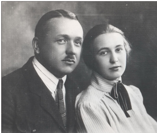
Фот. 1. Командувач 3-ої Залізної стрілецької дивізії генштабу генерал-хорунжий Олександр Удовиченко разом зі своєю дружиною Вікторією, фото зроблено в таборі Каліш у 1922 р.