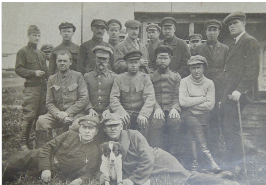
Фот. 2. Група інтернованих у таборі Каліш, 11 червня 1924 р.