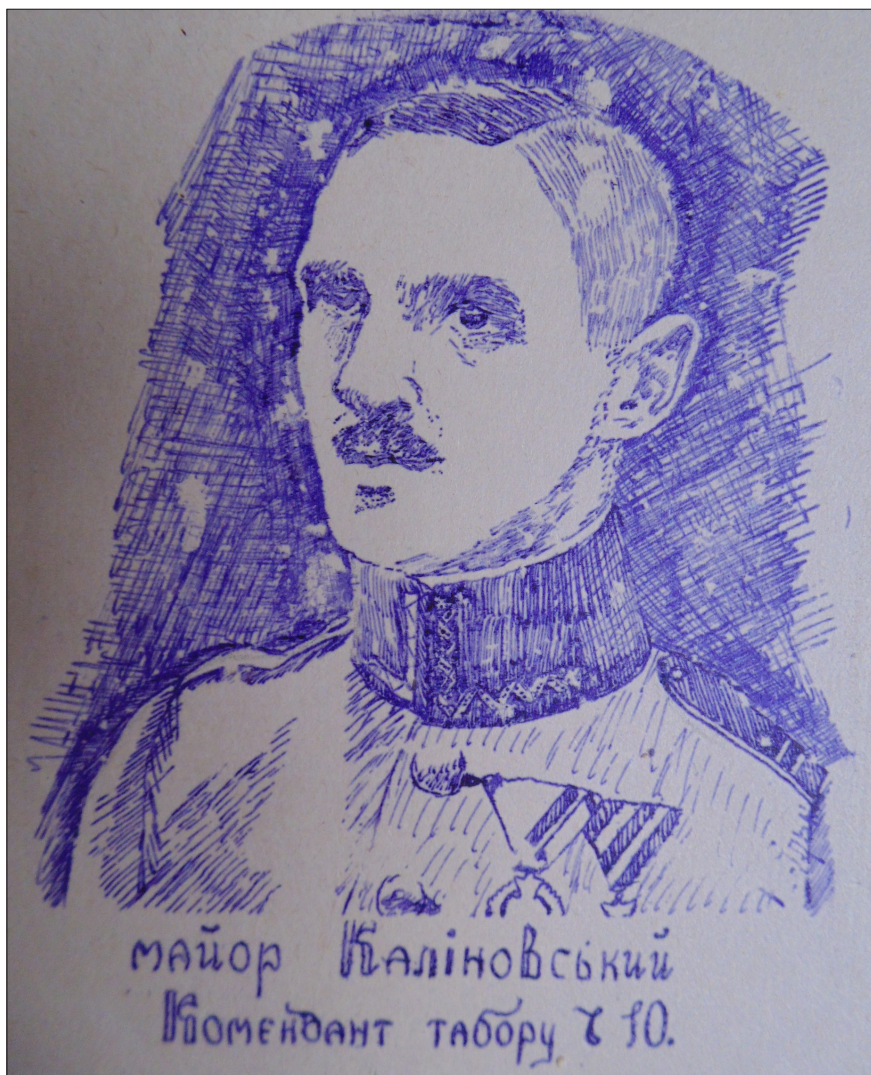
Мал. 4. Малюнок польського коменданта табору майора Євгенія Юзефа Каліновського, який був уміщений у ч.19 журналу «Око» (від 5 червня 1921 р.), Каліш. (ЦДАВО України, ф.3525, оп. 1, спр. 14, арк. 196)