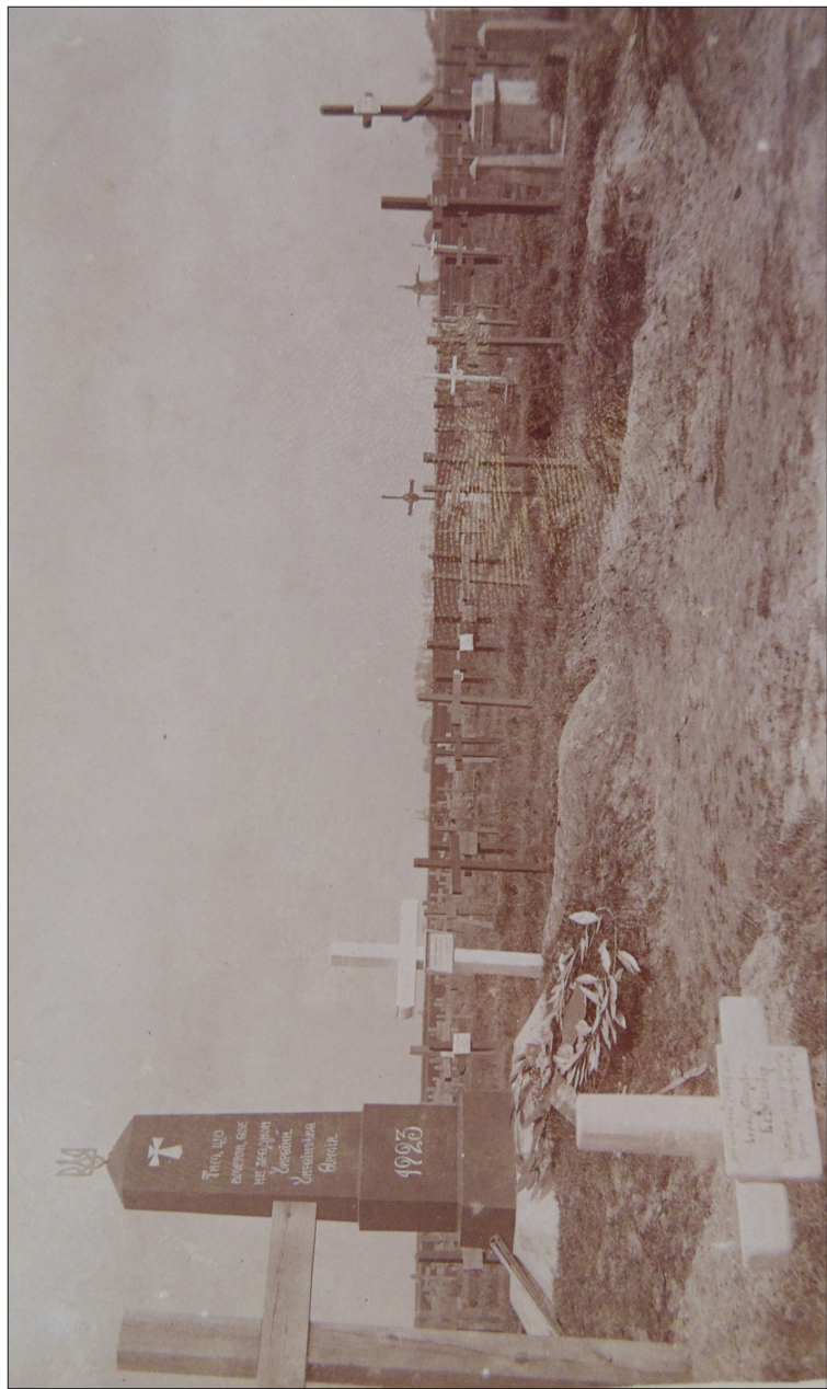
Фот. 4. Видляд Шципюрнського цвинтаря 1924 р. (оригінальний надпис на звороті фотографії). Надпис на пам'ятнику: Тим, що вмерли, але не зрадили Україні. Українська Армія.