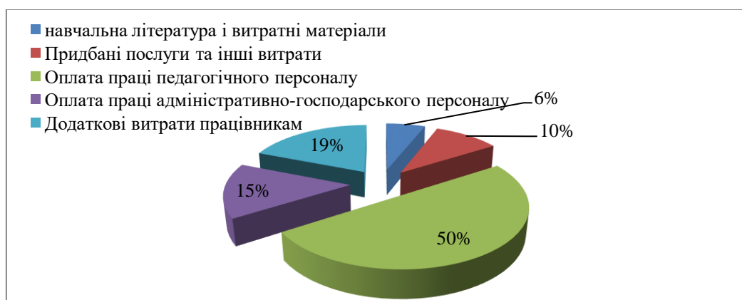
Рис. 3. Структура витрат шкільного округу штату Каліфорнія у 2019/2020 н.р. за об'єктами фінансування (побудовано авторами за даними джерела [27])

Для прикладу розглянемо структуру витрат одного зі шкільних округів штату Каліфорнія в 2019/2020 навчальному році (рис. 3) [28].