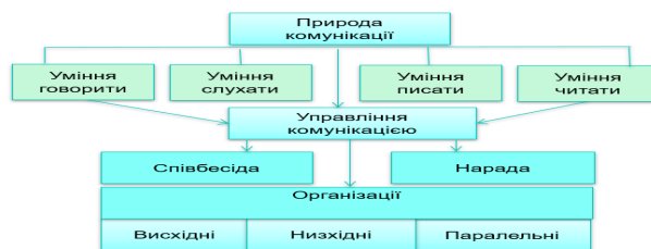
Рис. 1. Природа комунікації

Таким чином, для ефективної комунікації керівникам закладів освіти необхідно усвідомити свої персональні навички, свою здатність керувати процесом комунікації в групах, а також свою ефективність у відстеженні висхідних, низхідних і паралельних потоків інформації та ідей всередині організації, охоплюючи, зрозуміло, взаємодію організації з освітянами.