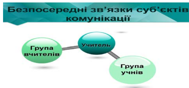
Рис. 2. Безпосередні зв'язки суб'єктів комунікації

Професійно-педагогічна комунікація реалізується як система найрізноманітніших безпосередніх та опосередкованих зв'язків суб'єктів комунікацій (див. рис. 2).