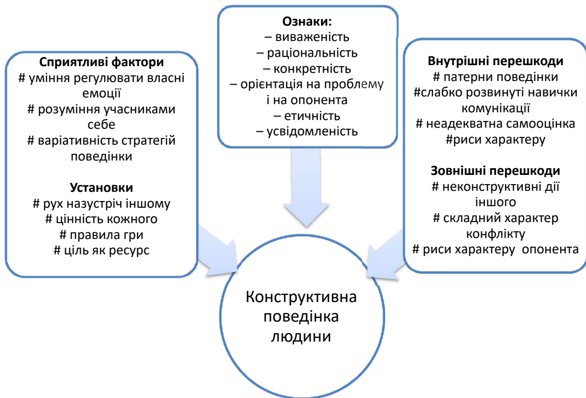
Рис. 2. Модель конструктивної поведінки людини в конфлікті

Проаналізовано перешкоди внутрішнього і зовнішнього характеру, що заважають конструктивній поведінці людини в конфлікті. До перших належать, зокрема, стійкі патерни поведінки, недостатньо розвинуті комунікативні навички, неадекватна самооцінка та певні риси характеру суб'єкта. До зовнішніх перешкод фахівці віднесли неконструктивні дії іншого учасника конфлікту, складний характер конфлікту, певні риси характеру опонента. З'ясовано ключові фактори, що найбільшою мірою сприяють конструктивній поведінці людини