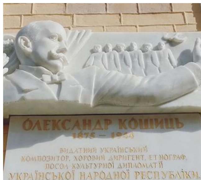
Меморіальна дошка на Андріївському узвозі, 13 Memorial plaque at Andriivsky Uzviz, 13

На цьому будинку в грудні 2021 р. відкрили меморіальну дошку Олександр Кошицю. Ще одну розмістили на Андріївському узвозі №13, у будинку Листовничого, де нині розташований Літературно-меморіальний музей М. Булгакова. Але ця адреса не згадується у «Спогадах».