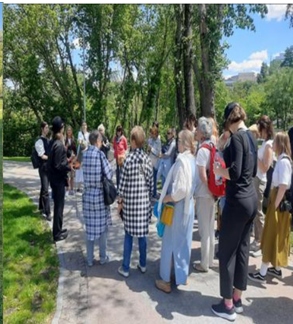
Експедиція до Дня Києва Excursion to the Day of Kyiv