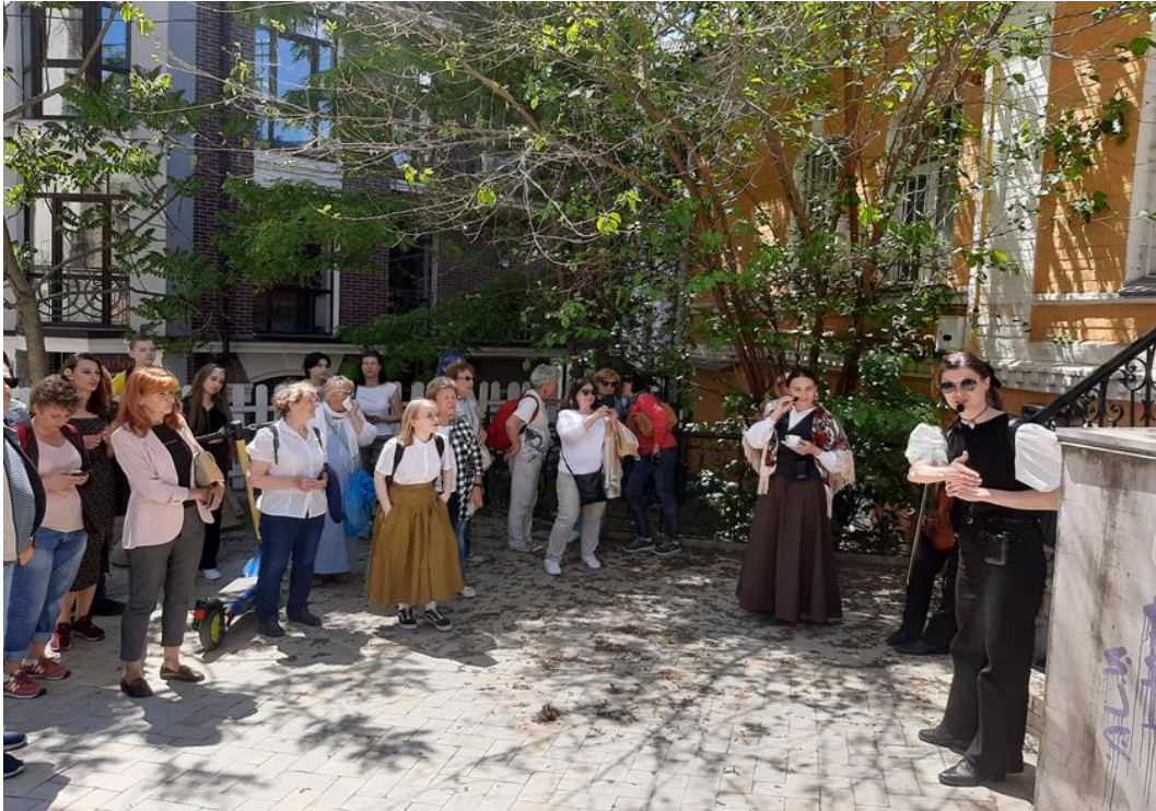
Андріївський узвіз, 22-А. Фрагмент екскурсії Andriivskiy Uzviz, 22A. Excursion fragment

На цьому будинку в грудні 2021 р. відкрили меморіальну дошку Олександр Кошицю. Ще одну розмістили на Андріївському узвозі №13, у будинку Листовничого, де нині розташований Літературно-меморіальний музей М. Булгакова. Але ця адреса не згадується у «Спогадах».