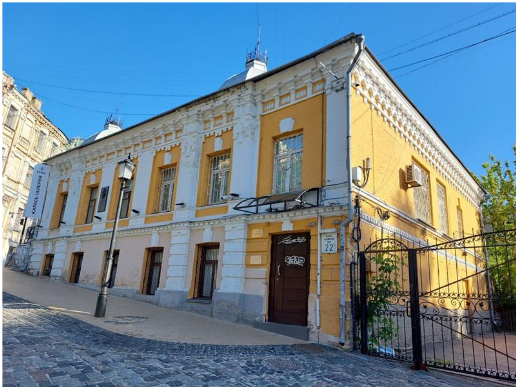
Андріївський узвіз, 22-А. Сучасний вигляд Andriivskyi Uzviz, 22-A. Modern appearance