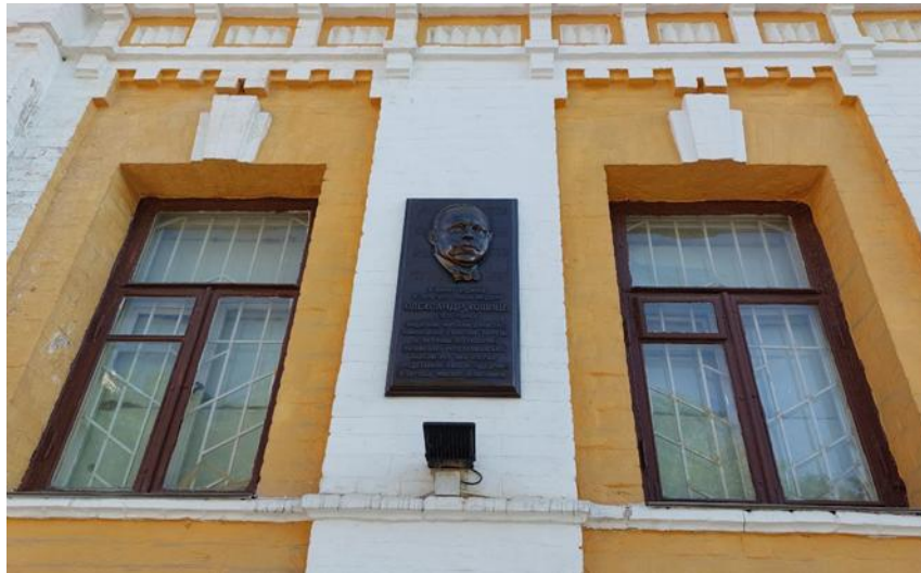
Меморіальна дошка Олександр Кошицю на будинку Андріївський узвіз, 22-А Memorial plaque to Oleksandr Koshyts at the Andriivskyi Uzviz building, 22-A