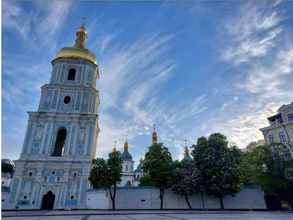
Софійський собор Sophia Cathedral

Перша київська локація – біля Софійського собору: «Сіли і прямо в готель “Женева”, біля Софії». «Коли я вийшов на вулицю та глянув ліворуч угору – на мене наче посунулася колосальна біла гора з золотим верхом, що прямо сліпила очі – це була дзвіниця Софії. Хрест здавався під самим блакитним небом, по якому бігли біленькі, легкі хмарки. Коли глянути на хрест та небо, то здавалось, що хмари стоять, а дзвіниця сунеться на тебе – от-от упаде. Страшно, моторошно й радісно. Тоді я ще не міг усвідомити архітектурної краси, але мене вразило “щось”. І досі ще свіже те перше враження... І коли заплющу очі, то не тільки бачу цю дзвіницю, але майже переживаю те ж хвилювання що й тоді» 5 , – перші враження Олександра Кошиця від Києва