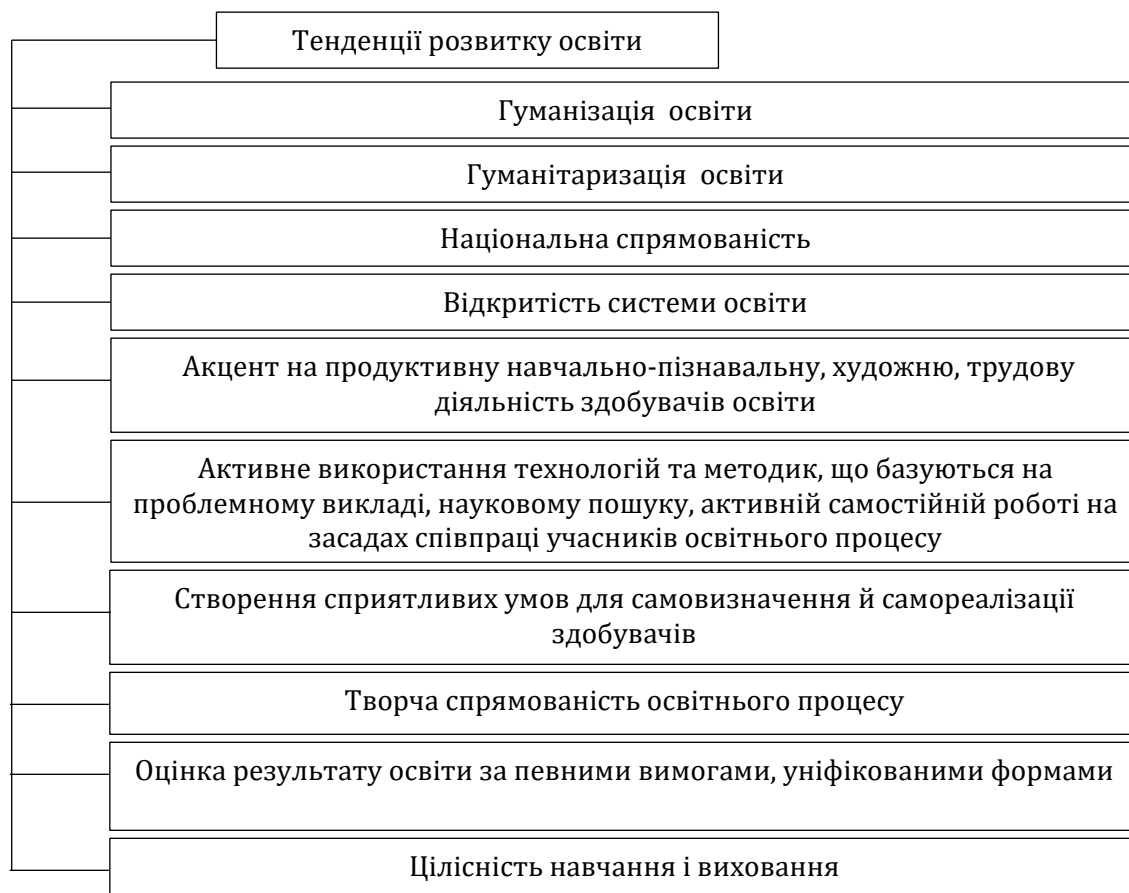
Рис. 2. Основні тенденції розвитку освіти в Україні

В умовах дистанційного навчання спільна проблема для всіх учасників – відсутність електрики та Інтернет-з'єднання, погана якість та низька швидкість доступного Інтернету, застаріле комп'ютерне обладнання.