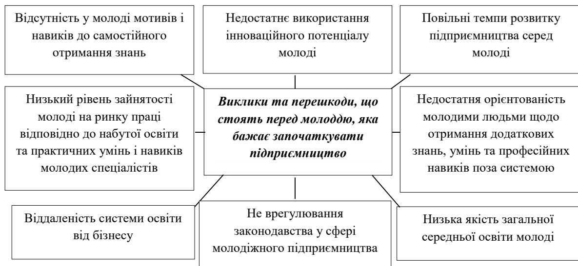
Рис. 1. Перешкоди та виклики в питаннях становлення молодіжного підприємництва (згруповано авторами на основі джерел [1; 2, с. 38])

Та в умовах воєнного стану є ще низка перешкод та викликів, що постають перед молоддю, зокрема в східних регіонах України, чим ближче до лінії зіткнення вони проживають (рис. 1). Хоч професійно-технічні заклади освіти націлені на розвиток професійних навичок у молодого покоління та їх підготовку відповідно до запитів ринку праці, та, на жаль, освітні заклади не мають сучасних матеріальних ресурсів, або вони є пошкодженими чи знищеними армією РФ. За таких обставин ЗВО не можуть належним чином забезпечити молодь знаннями та професійними навичками, що є актуальними для інноваційно-цифрового рівня розвитку економік провідних країн світу.