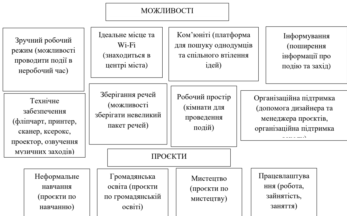
Рис. 2. Візуальний зріз можливостей та напрямів проектної діяльності “Молодіжного центру. Тернопіль” в частині підтримки ініціатив молодіжного підприємництва (згруповано авторами на основі джерела [14])

Корисними ініціативами підтримки розвитку молодіжного підприємництва в Україні різного центри підтримки бізнес-ініціатив молоді. Одним із таких є в нас сьогодні “Молодіжний центр. Тернопіль”. Він позиціонує себе як вільний майданчик для підтримки культурних та соціальних ініціатив саме міста Тернополя. Також він є місцем для навчань. Місія даного центру – створення нових якісних можливостей для активної молоді міста Тернополя через забезпечення роботи різноманітних майданчиків, а саме: дієвий майданчик з технічним забезпеченням; відкритий простір для генерування ідей та проектної роботи; крамничка рукотворів та особливих виробів; творча майстерка для мистецького розвитку; вуличний простір для відпочинку та велостоянка [14]. Можливості, що надає даний центр, ми зробили спробу представити на рисунку 2.