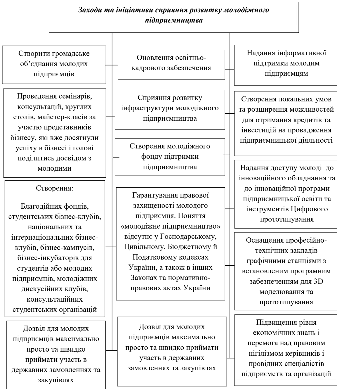
Рис. 3. Заходи та ініціативи сприяння розвитку молодіжного підприємництва в умовах воєнного стану в Україні (складено авторами на основі джерел [20; 18; 2, с. 39; 11, с. 360])

нестандартним способом мислення, новим типом підприємницької поведінки. Тому важливе значення для розвитку і удосконалення “підприємницьких контрактів” мають особисті якості, соціальна роль і розвиток культури молодого підприємця. В даному випадку, це зумовлено характером процесу соціалізації особистості як суб’єкта підприємницької діяльності” [5, с. 27–28, 29]. Чинники, що впливають на процес інституціоналізації українського молодіжного підприємництва представлено на рисунку 4.