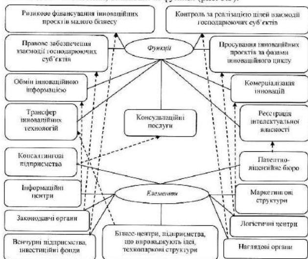
Рис. 3.3 – Взаємозв'язок та взаємодія інститутів інфраструктури інноваційної економіки.

знаходяться в складі вище вказаних підсистем. Спробуємо відтворити можливий механізм взаємозв'язків і взаємодії інститутів інфраструктури інноваційної економіки, вказавши їх функції (рис. 3.3).