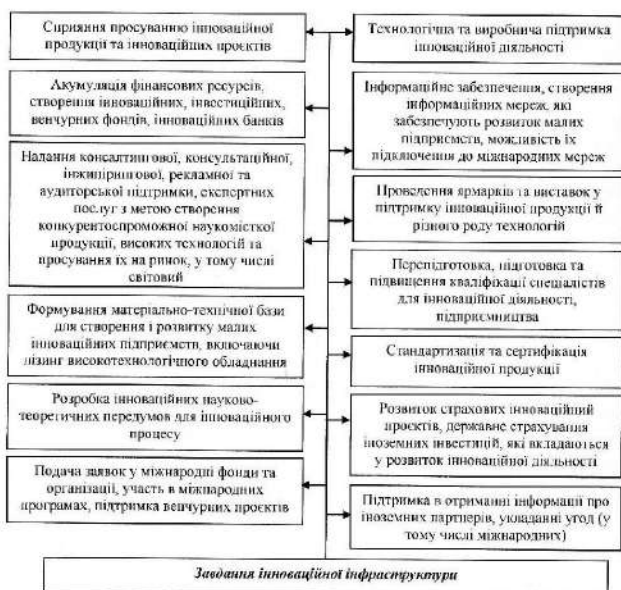
Рис. 1.3 – Основні завдання інноваційної інфраструктури.

Інноваційна інфраструктура повинна бути націлена на рішення стратегічних задач розвитку (рис. 2.3) і реалізацію венчурними підприємствами та інститутами інноваційного розвитку потенційних конкурентних переваг, побудови взаємодії і взаємозв'язків між всіма регіонами країни, пошук закордонних партнерів, ініціювання програм на державному рівні із залученням організацій та спеціалістів-інноваторів з різних сфер науки і техніки.