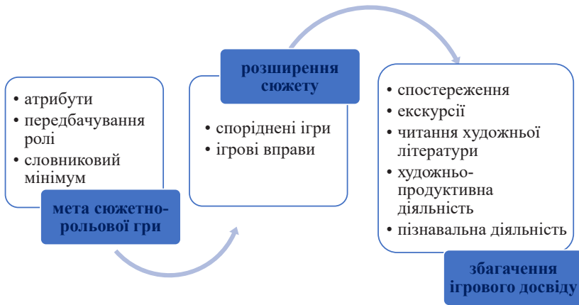
Рис. 1. Алгоритм підготовки вихователя до супроводу сюжетно-рольової гри

такої гри ініційованої дитиною, з розгортанням та урізноманітненням сюжету, тобто, довготривалої гри – підготовка досить тривала і активність її здійснення має розпочинатися саме в ранньому віці. Окрему увагу в супроводі сюжетно-рольових ігор дітей третього року життя слід приділити збагаченню ігрового досвіду, через те, що дітям, зважаючи на віковий розвиток, бракує навичок самоорганізації, планування ігрових дій, знань правил гри, способів урегулювання конфліктів або подальшого розгортання сюжету тощо. Алгоритм підготовки вихователя до супроводу сюжетно-рольової гри представлено на рис. 1.