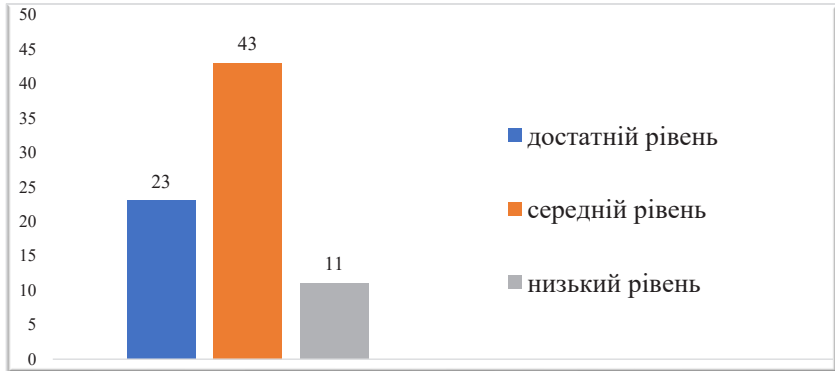
Рис. 2. Рівень готовності майбутніх дошкільних педагогів до супроводу сюжетно-рольових ігор дітей третього року життя

тальної мапи представити алгоритм його підготовки та використання. Середній рівень діяльнісного компонента готовності виявлено у студентів, які припустились методичних помилок при виконанні діагностичного завдання, не достатньо чітко, поверхово прописали алгоритм підготовки та використання обраного методу супроводу сюжетно-рольових ігор дітей третього року життя. Низький рівень діяльнісного компонента готовності виявлено у студентів, які припустились суттєвих помилок у виконанні діагностичного завдання, виявили труднощі у виборі методу, плутають методи і прийоми, не змогли скласти алгоритм підготовки та використання обраного методу супроводу сюжетно-рольових ігор дітей третього року життя.