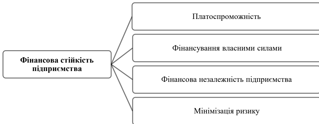
Рис. 1. Головні складові поняття «фінансова стійкість» підприємства