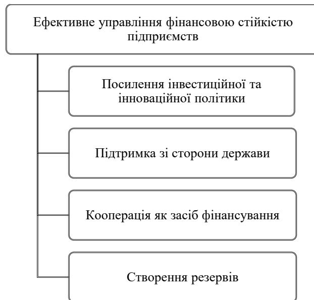
Рис.4. Компоненти ефективного управління фінансовою стійкістю підприємств в умовах воєнного стану