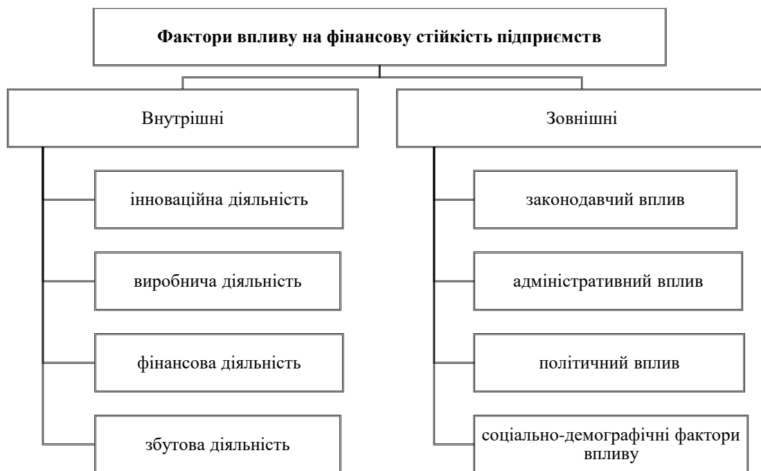
Рис.3. Фактори впливу на фінансову стійкість підприємств

Важливо зазначити, що діяльність компанії можна розглядати як ззовні, так і всередині. Зовнішній вимір фінансової стійкості компанії пов'язаний зі стабільністю економічного середовища, в якому вона працює, і забезпечується відповідними національними макроекономічними правилами ринкової економіки. У свою чергу, внутрішні виміри фінансової стійкості відображають становище ресурсного потенціалу та його динаміку, які забезпечують стабільно високі фінансово-економічні показники компанії. Метою цього твердження є продемонструвати доцільність розподілу факторів, що мають вплив на фінансову стійкість підприємства, на дві групи – зовнішні й внутрішні [10, С.24-31]., які презентовані на рис.3.