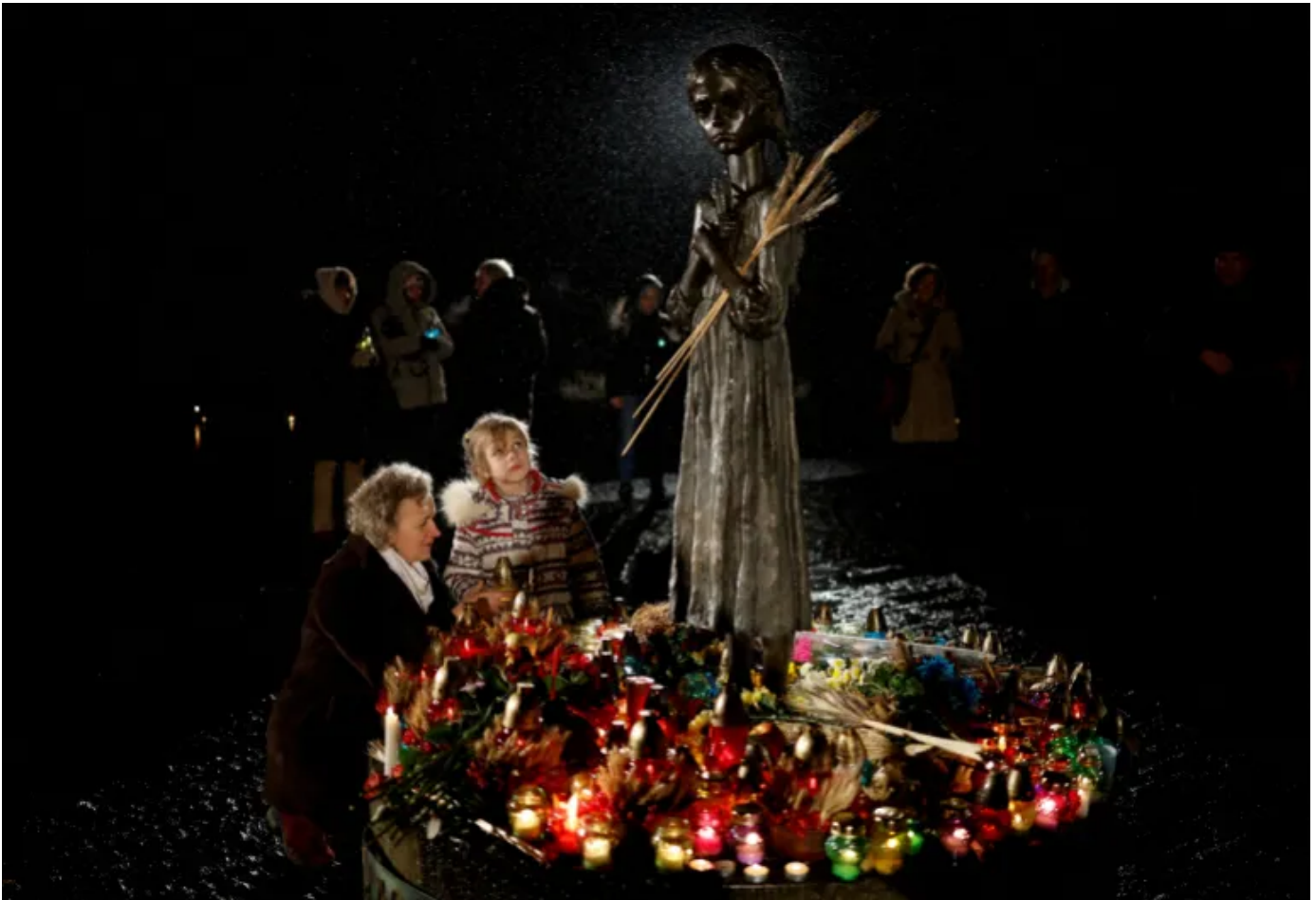
Spomenik Holodomoru u Kijevu: Tokom 1932. i 1933. godine između 3,5 i 10 miliona Ukrajinaca je umrlo od gladi

Tokom 1990-ih su objavljivani dekreti sa mjerama komemoracija za godišnjice, da bi 2006. Verkhovna Rada Ukrajine (Parlament Ukrajine) usvojila Zakon o Holodomoru u Ukrajini 1932-1933 kojim se zvanično priznaje Holodomor kao genocid.