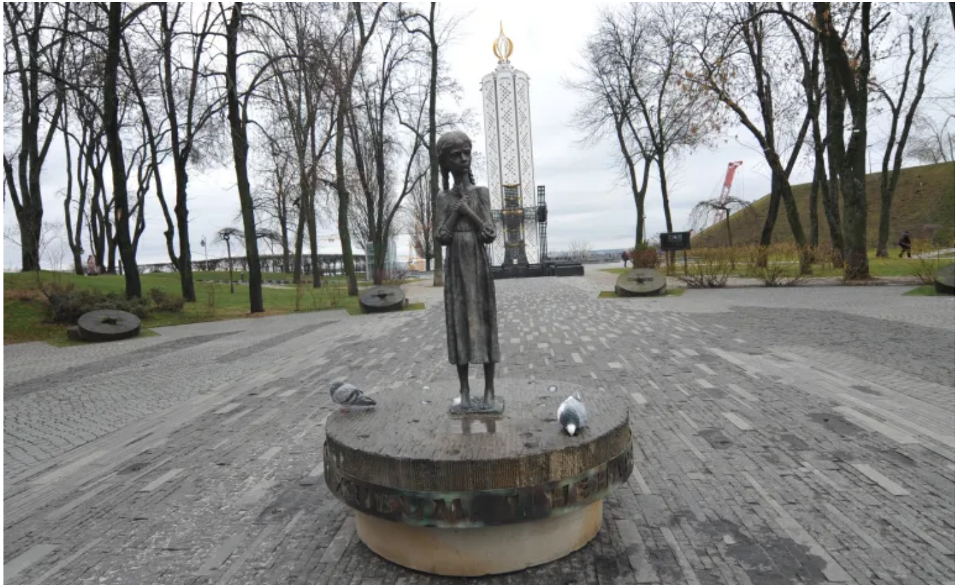
Ukrajinski historičari kažu kako je u Holodomoru umrlo nekoliko miliona ljudi, ne manje od 3,9 miliona

– Slažem se. Posljedice Holodomora su i dalje prisutne u životima Ukrajinaca. Puste regije nakon raseljavanja naseljene su Rusima i tako su napravljene osnove za određenu podjelu na Istok (ruski jezik) i Zapad (ukrajinski), sa različitim stavovima ka historiji, jeziku, religiji... Ovo je također utjecalo i na vanjskopolitičke stavove, naročito kada je riječ o odnosima prema Zapadu i/ili Rusiji, što je vidljivo tokom izbornih kampanja.