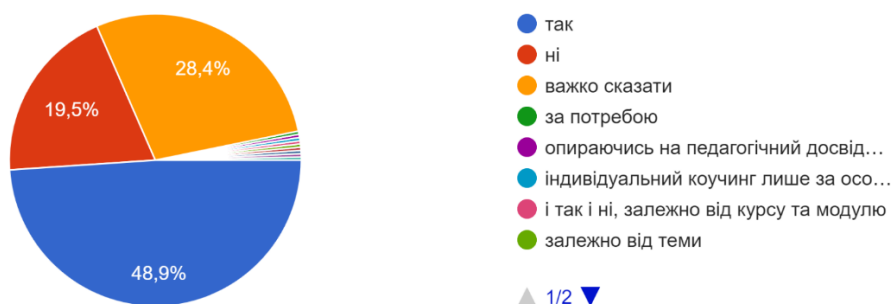
Рисунок 4. Відповіді вчителів щодо потреб у індивідуальному коучингу.

Основними напрямками власного професійного розвитку в умовах війни педагогами зазначені: