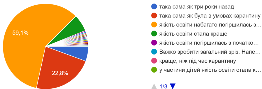
Рисунок 1. Відповіді вчителів, щодо якості освіти в умовах війни.

Яка Ваша думка щодо якості освіти сьогодні? 232 відповіді