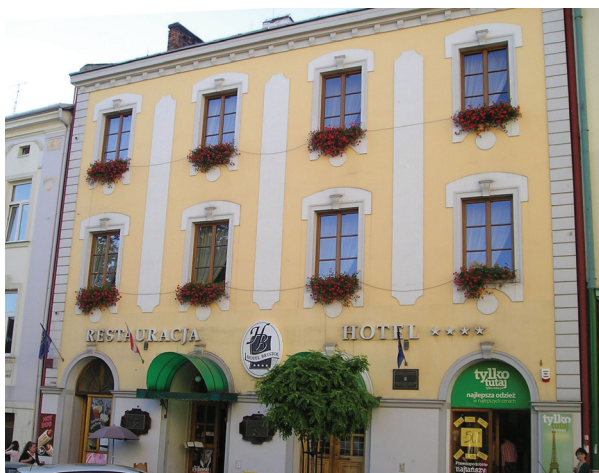
Готель «Брістоль», Тарнів (Польща), в якому перебував ДЦ УНР в екзилі у 1921 р. (сучасний вигляд)

мав чи з ним конкурував. Це дозволило на якийсь час згуртувати сили навколо судового процесу, який закінчився дивним рішенням паризького суду, що виправдав вбивцю 1 . З іншого боку, Державний центр ніс на собі ознаки поразки національно-визвольних змагань. Проти ослабленого ДЦ виступили і колишні союзники, і противники. Колишні союзники соціалісти-революціонери більш жорстко критикували ДЦ, соціал-демократи – займали нішу поміркованої опозиції. Із зрозумілих причин, у непримиреній опозиції залишалися гетьманці.