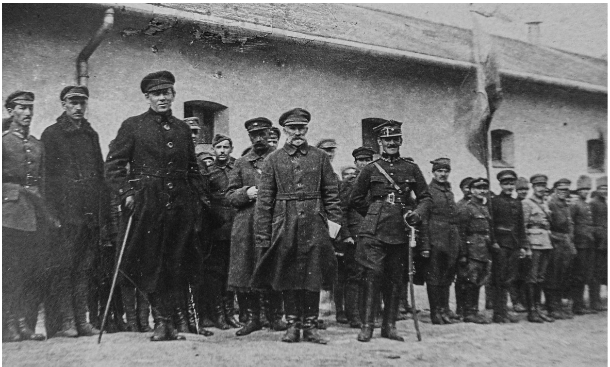
Симон Петлюра серед вояків Армії УНР в одному з таборів інтернованих, 1921 р.