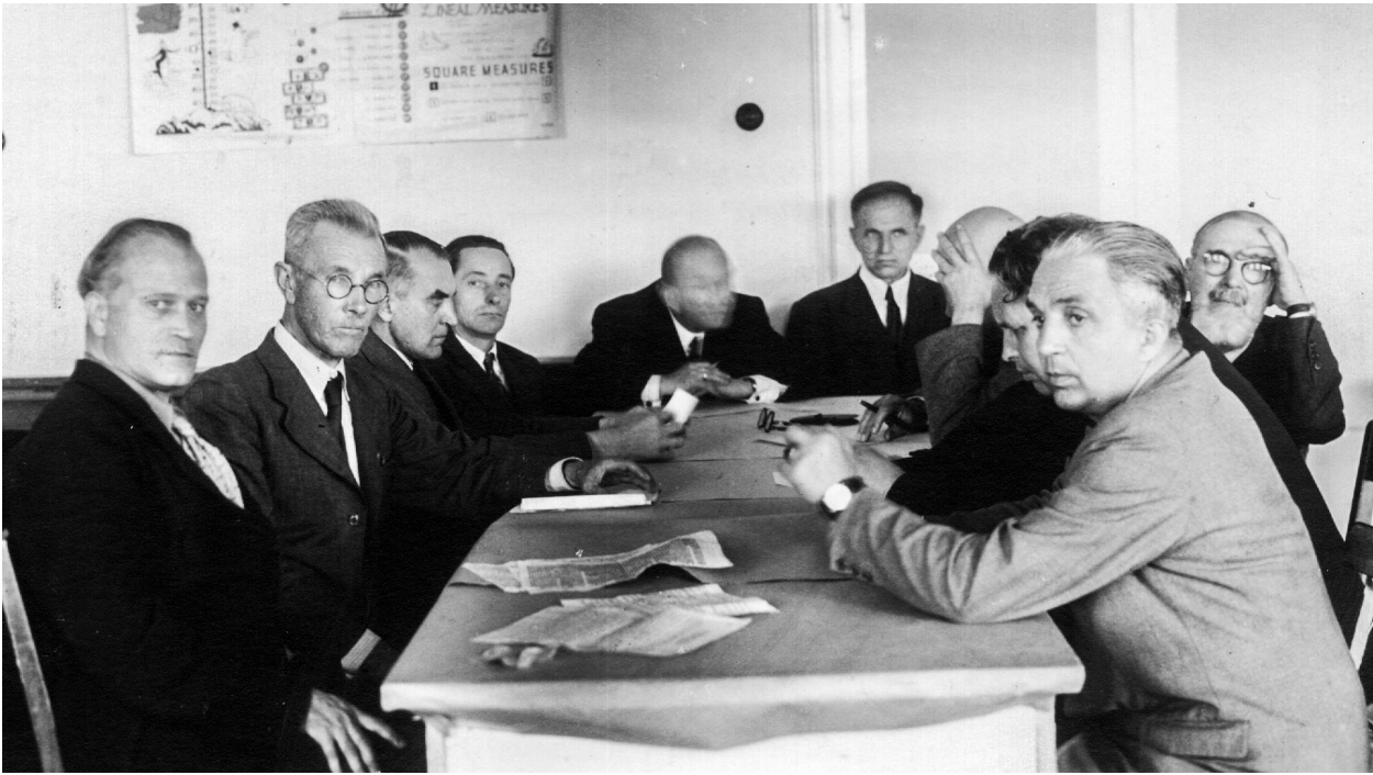
Засідання уряду УНР, Німеччина, 1951 р.

інші політичні середовища на ці пропозиції не пристали. Наприкінці весни 1948 року остаточний текст «Тимчасового закону» був завершений. У червні цього ж року, перед початком роботи передпарламенту – Української національної ради (УНРади) ця «еміграційна конституція» була підписана президентом Андрієм Лівіцьким.