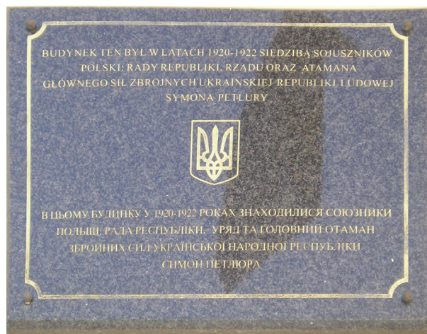
Меморіальна дошка в Тарнові

один із ідеологів українських націоналістів Микола Сціборський був близький до ідей італійського фашизму. Тут треба зауважити, що ми не повинні сприймати співпрацю у міжвоєнний період із нацистським чи фашистським режимами як щось надзвичайне. Із Беніто Муссоліні, Адольфом Гітлером співпрацювали як уряди Франції чи Великої Британії, так і Радянського Союзу. Це були ті реалії, якими жив світ. Українські політики, розчарувавшись у політиці країн-переможців у Першій світовій війні, намагалися шукати союзників серед їх опонентів.