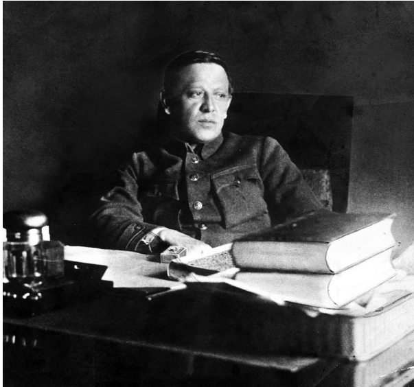
Голова Директорії УНР і Головний отаман військ УНР Симон Петлюра

Не секрет, що з листопада 1918 року по листопад 1920 року Директорія УНР провадила постійні військові дії із супротивниками. Історики нараховують у 1919 р. шість армій на території УНР, які вели збройну боротьбу проти неї. Із кінця січня 1919 року, Директорія та уряд були змушені до постійних переміщень між Києвом, Житомиром, Рівним, Кам'янцем-Подільським, Вінницею та іншими містами Правобе-