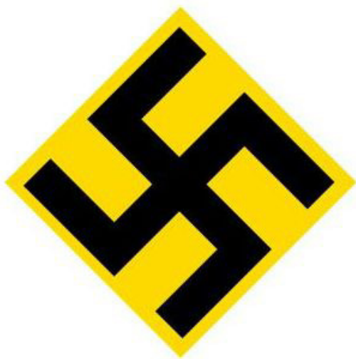
Рис. 5. Прапор всеросійської фашистської партії.

ВФП видавала журнал «Нація» (Шанхай) та газети «Наш шлях» (згодом перенесено редакцію у Харбін). Організація мала свій прапор – полотнище з чорною свастикою на жовтому фоні ромбу в білому прямокутнику (Рис. 5). Партійне вітання – підняття правої руки від серця в гору з вигуком «Слава Росії!» 2 .