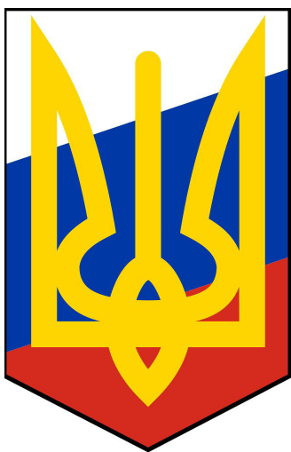
Рис. 1. Основна партійна емблема «Національно-трудового союзу нового покоління».

Головною метою НТСНП було повалення комуністичного ладу в СРСР та побудова корпоративної держави (під час Другої світової війни термін «корпоративна держава» було замінено на «солідаризм»). 1936 р. Союз затвердив свою основну емблему – тризуб на фоні російського триколора (Рис. 1).