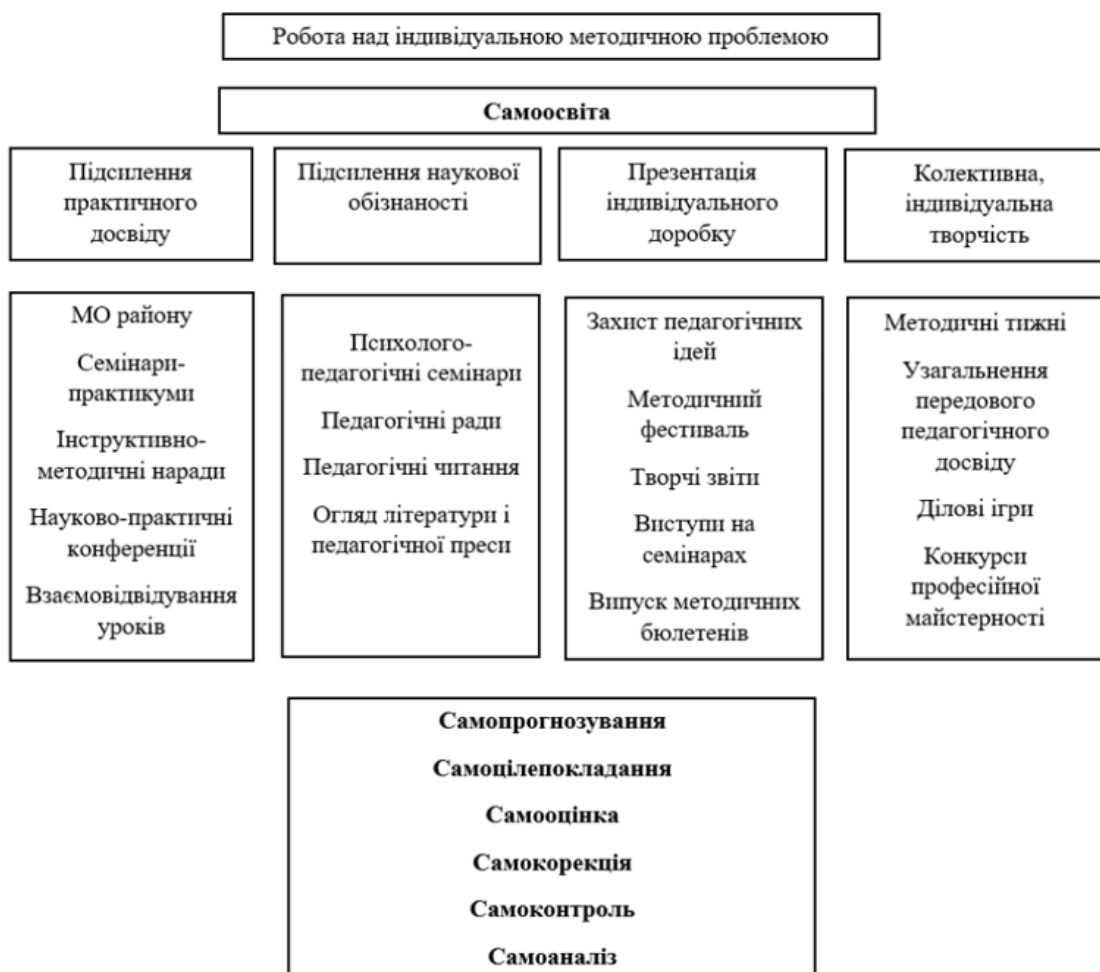
Рис. 2. Напрями реалізації самоосвітньої діяльності освітян