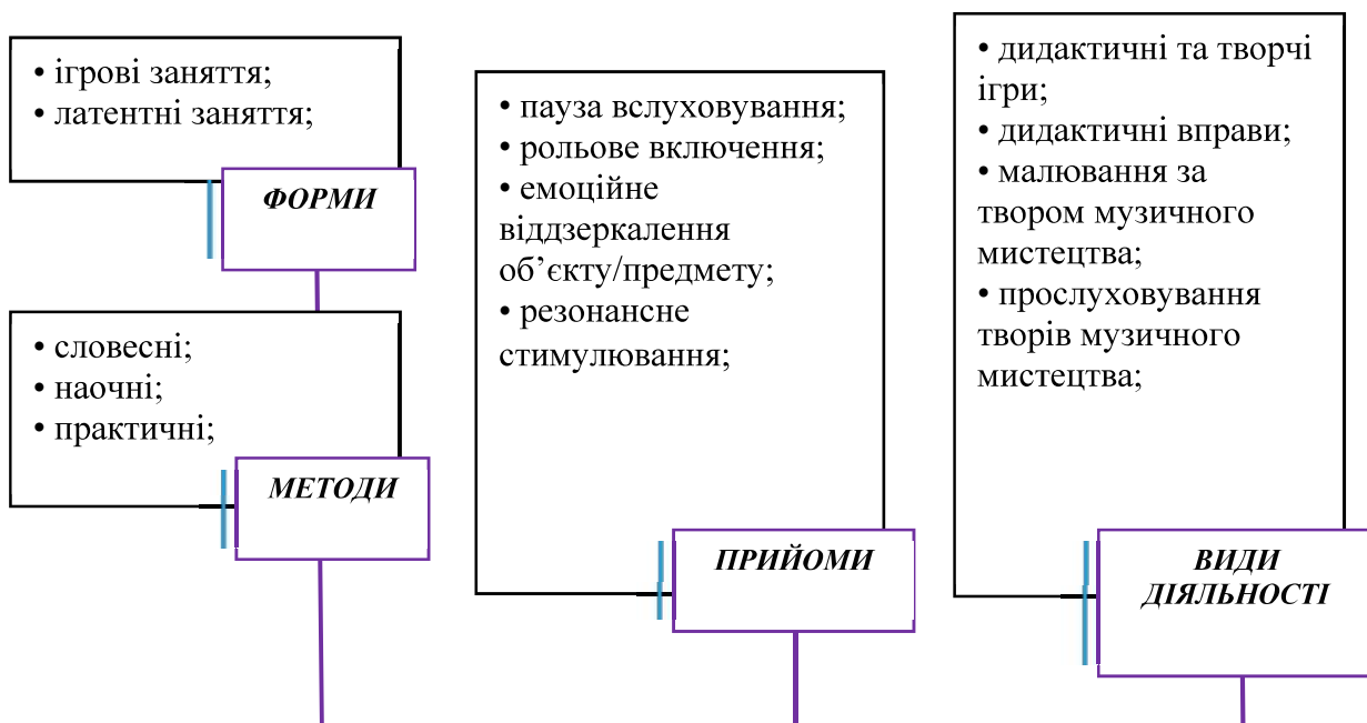
Рис.1 Структурована модель покращення емоційного стану та загального розвитку дітей дошкільного віку засобами музичного мистецтва

Застосування творів музичного мистецтва, задля покращення емоційного стану та загального розвитку дітей старшого дошкільного віку, потребує чітко означених форм, методів, та прийомів адаптованих до вікових можливостей дітей старшого дошкільного віку. В межах даного дослідження вони були підібрані наступним чином (Рис.1):