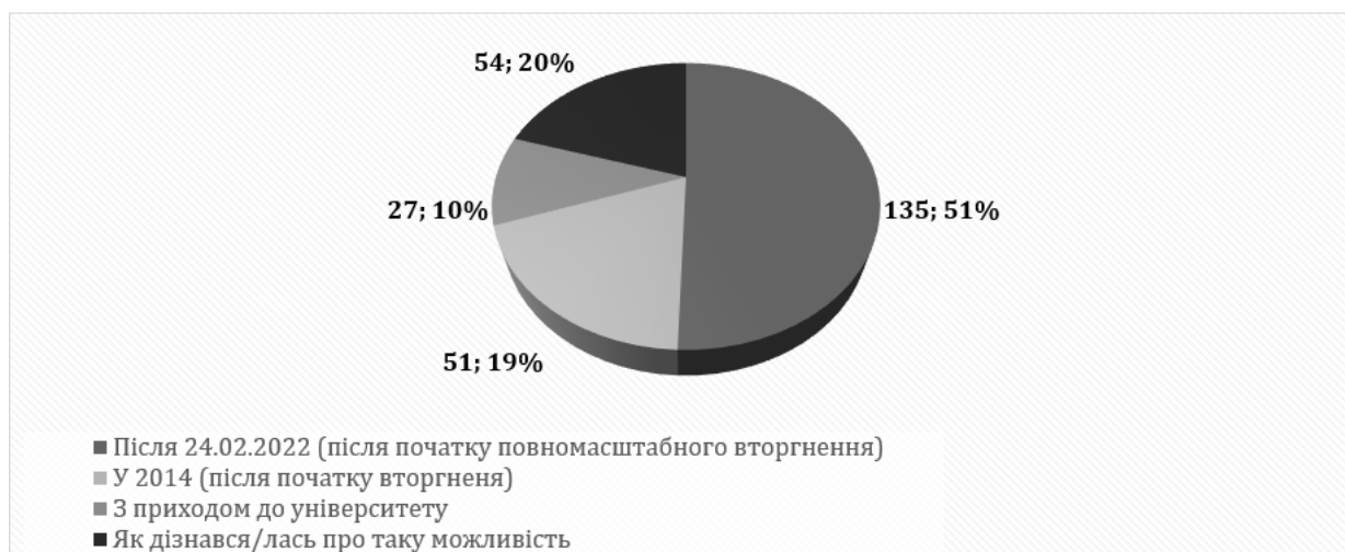
Рис. 2. Відповідь на питання «Коли ви почали свій шлях волонтера?»