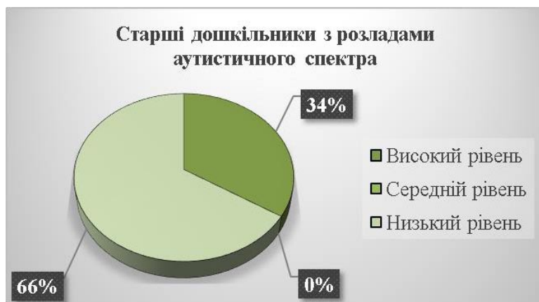
Рис. 3. Стан сформованості лексичної складової мовлення дітей старшого дошкільного віку з аутизмом (у %)

Результати дослідження підкреслюють важливість індивідуального підходу та роботи з дітьми з розладами аутистичного спектра в контексті мовленнєвого розвитку. Ефективність такого дослідження полягає в можливості ідентифікації індивідуальних потреб кожної дитини та наданні відповідних підходів та інтервенцій для покращення їх мовленнєвого розвитку.