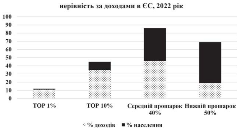
Рис. 1. Нерівність за доходами в ЄС, 2022 рік