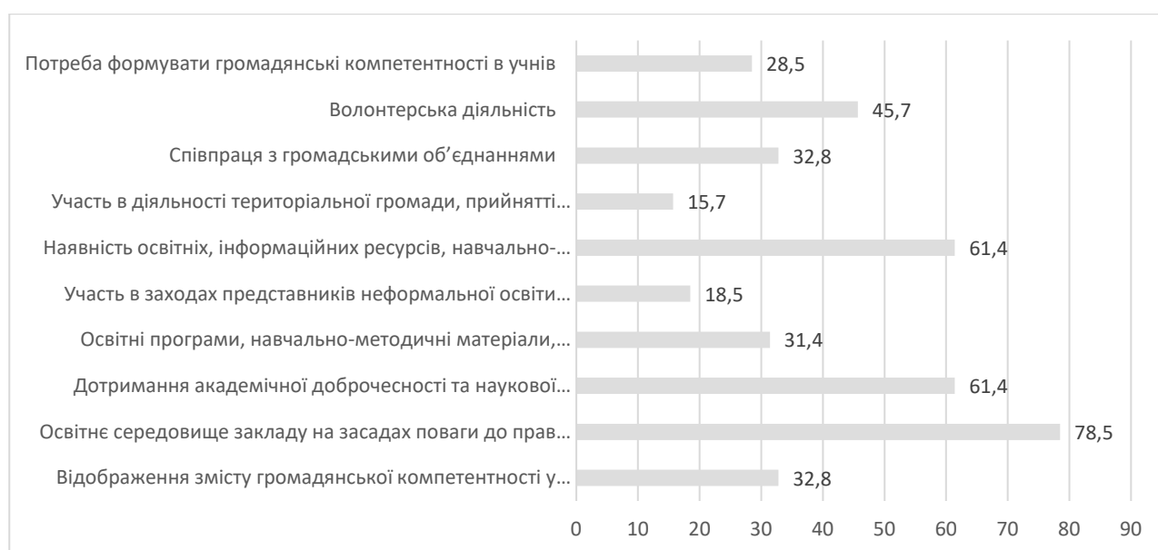
Рисунок 2. Стимулюючі фактори розвитку громадянської компетентності педагогів

У відповідь на запитання: “Які із запропонованих умов стимулюють розвиток Вашої громадянської компетентності?”, 78,5% педагогів зазначили, що їх стимулює освітнє середовище закладу освіти на засадах поваги до прав людини і демократії, відповідальності за власні та колективні рішення. Наявність освітніх, інформаційних ресурсів, навчально-методичних матеріалів, які є у вільному медійному просторі, дотримання академічної доброчесності та наукової обґрунтованості педагогами освітнього закладу - обрали по 61,4% вчителів. Значимими стимулами є волонтерська діяльність (45,7%); співпраця з громадськими об'єднаннями (32,8%); відображення змісту громадянської компетентності у нормативно-правових актах і стандартах освіти (32,8%); освітні програми, навчально-методичні матеріали, тренінги, майстер-класи з громадянської освіти, які пропонує Інститут післядипломної освіти під час підвищення кваліфікації педагогічних працівників (31,4%). Менш значимими для даної вибірки педагогів є такі стимули як: потреба формувати громадянські компетентності в учнів (28,5%); участь в заходах представників неформальної освіти (громадські організації, об'єднання тощо): відвідування тренінгів, майстер-класів, воркшопів (18,5%); участь в діяльності територіальної громади, прийняті рішень на місцевому рівні (15,7%). Дані результати відображені в гістограмі (рис.2).