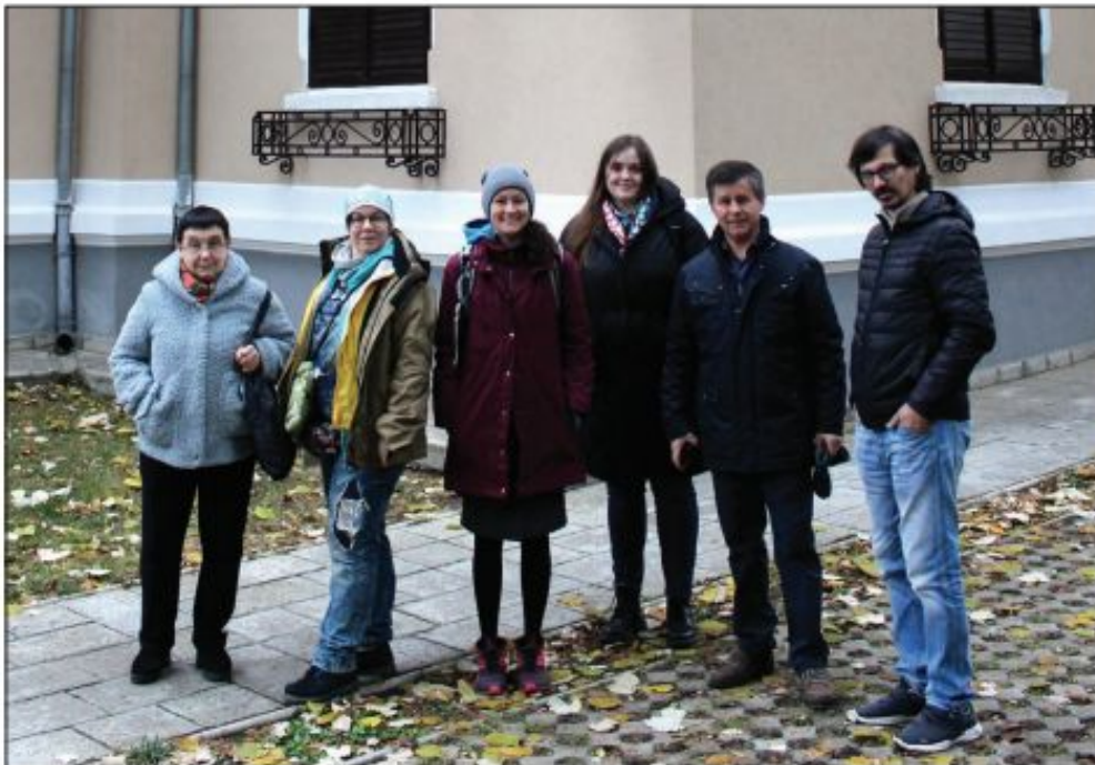
Відвідання українськими археологами археологічного музею Яеського університету під час конференції

безперервності досліджень та збереження археологічної спадщини документацією, засобами оцифрування тощо. Незважаючи на виклики