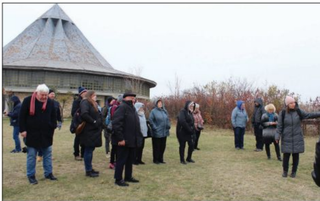
Екскурсія учасників конференції до заповідника у селі Кукутень.

Всього до програми конференції було включено близько 50 доповідей, частину яких представлено постерами. Враховуючи співавторів багатьох доповідей, загальне число учасників становило понад 80. Доповіді були структуровані у чотирьох сесіях, які відбувалися послідовно: «Потік людей, плавлення культур: Велике переселення народів та культурні трансформації навколо Карпат»; «На околиці імперій: взаємодія між степовими кочовиками, грецькими колоністами та римськими правителями»; «Кுவання металу, кування мереж: металургія міді та бронзи між Карпатами і Кавказом»; «Освоєння північно-понтійського степу: перехрестя ранніх землеробів і скотарів».