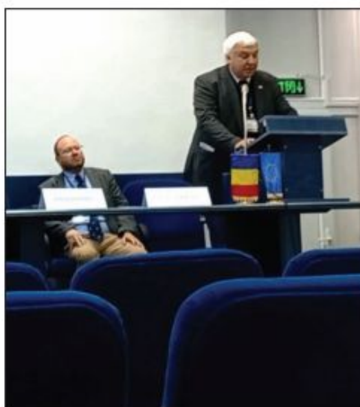
Відкриття конференції. Виступ Свенда Хансена, голови Євразійського департаменту DAI

Таким чином, у наш час особливої ваги набуває культурний і науковий обмін у цьому про-