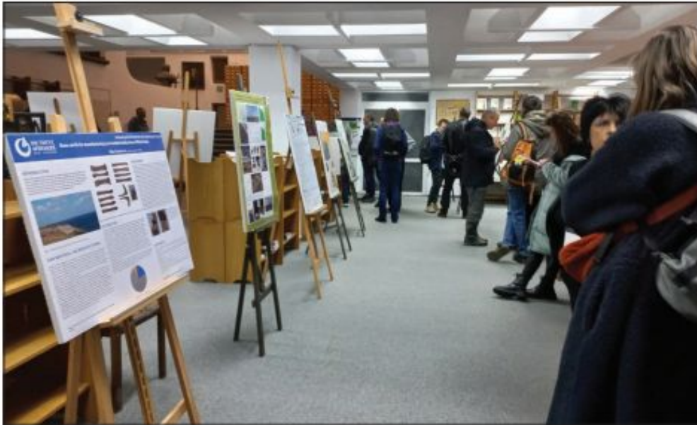
Сесія постерів на конференції