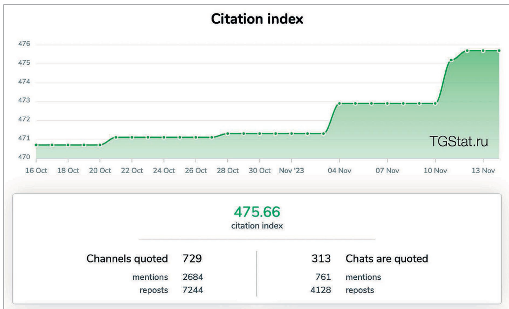
Рис. 3. Індекс цитування телеграм-каналу «Суспільне Херсон».

Окремо варто зазначити, що підтвердження зростання впливу регіонального телеграм-каналу «Суспільне Херсон» є його індекс цитування, який складає 475.66 (Рис. 3): 729 інших телеграм-каналів цитували «Суспільне Херсон» протягом повномасштабного вторгнення на момент написання цього дослідження, при чому цитування здійснювалось в українських (56,7%), російських (25,6%) та білоруських (2,1%) телеграм-каналах.