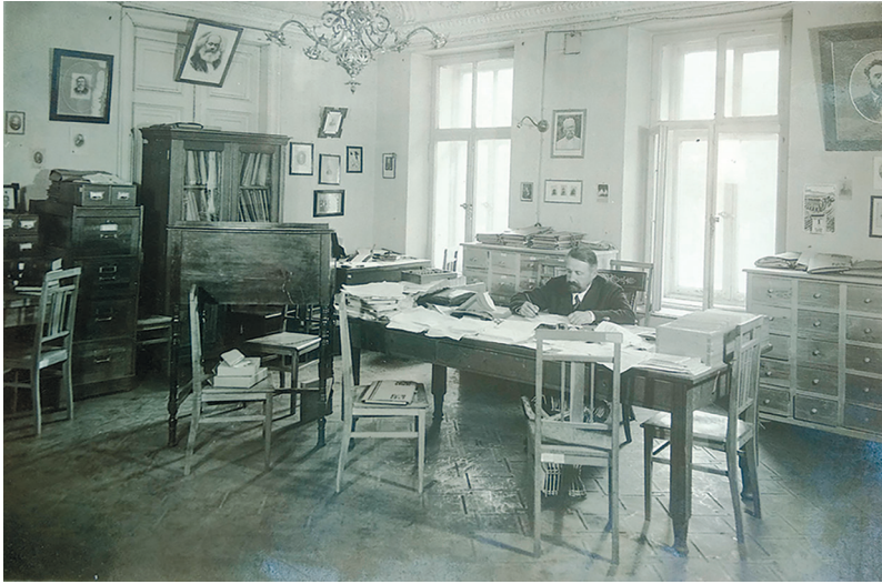
Рис. 4. В. Маслов — співробітник Етнографічної комісії ВУАН. Жовтень 1931 р. ІР НБУВ. Ф. 243. Спр. 1351. Арк. 4