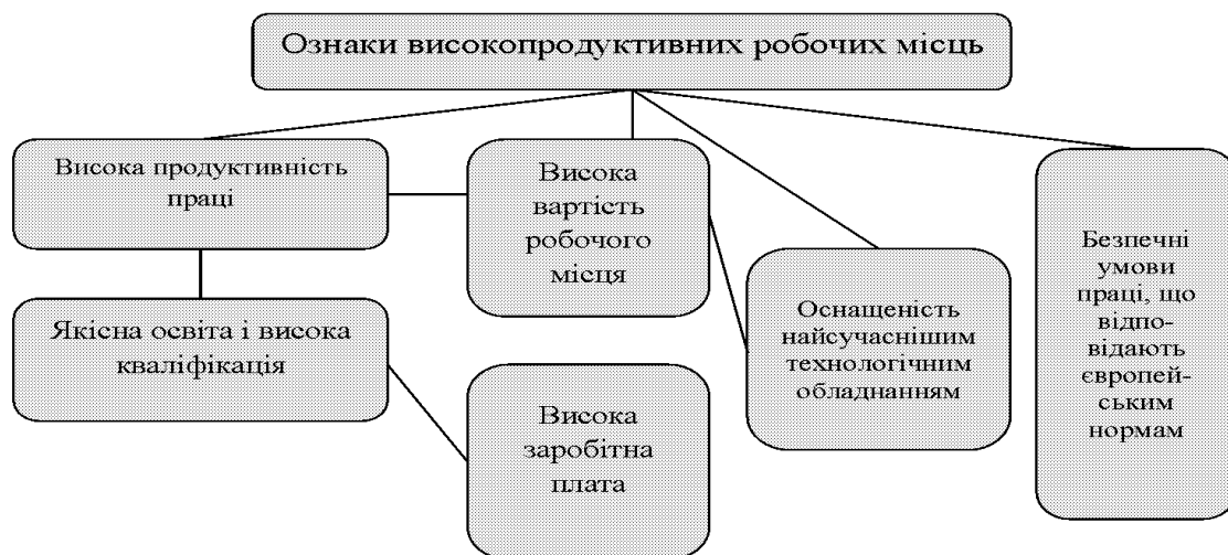
Рисунок 1 – Ознаки високопродуктивних робочих місць в економіці

Резюмуємо основні характеристики високопродуктивного робочого місця (рисунк 1).