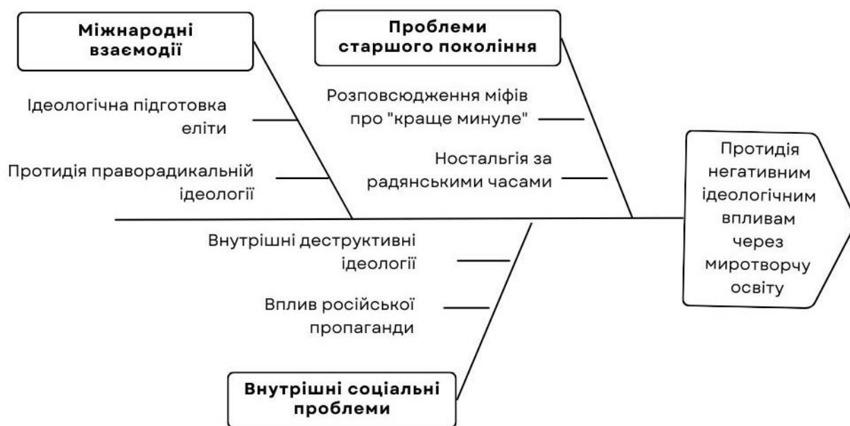
Рис. 5. Аналіз п'ятого аспекту підготовки концепції

Аспект п'ятий. В останні роки особливої гостроти набула проблема поширення право-націоналістичних ідеологій у світі. В умовах глобальних змін та політичних криз ці тенденції стають серйозним викликом, і українська концепція миротворчої освіти має передбачати ефективні механізми протидії цьому (див. рис 5).