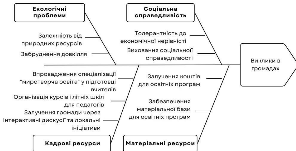
Рис. 6. Аналіз шостого аспекту підготовки концепції

педагогів, що працюють у середній та передвищій освіті, на рівні районів або областей.