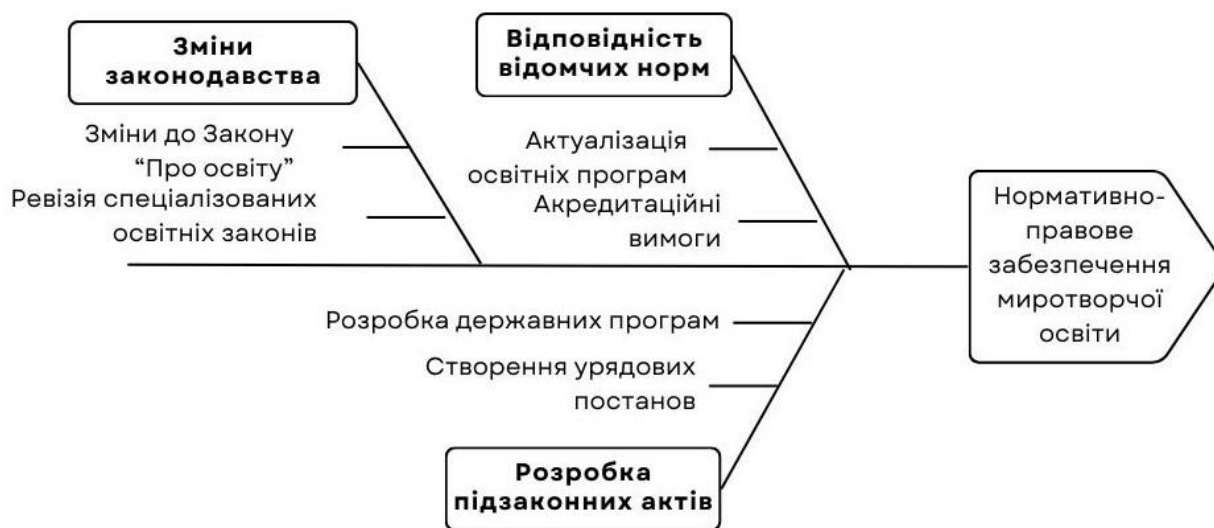
Рис. 1. Аналіз першого аспекту підготовки концепції

Аспект перший. Концепція має передбачати вдосконалення чинної нормативно-правової бази, щоб система освіти та популяризації миротворчих ідей спиралася на міцну правову основу.