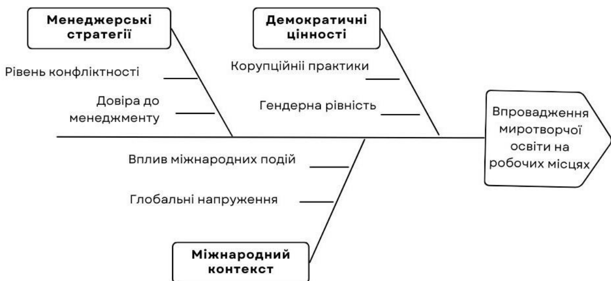
Рис. 4. Аналіз четвертого аспекту підготовки концепції

Аспект четвертий. Посилення миротворчого освітнього процесу в трудових колективах. Існує багато чинників коли миротворчі питання мають знаходити своє місце не тільки в навчальних програмах закладів освіти, а також бути перенесені в виробничі колективи на підприємства, установи, організації. Це є дуже важливий концептуальний напрям розвитку миротворчої освіти, оскільки освітньо-просвітницька діяльність тут щільно переплітається із практикою побудови толерантних мирних взаємовідносин між людьми, що проводять багато часу разом. Можна виділити наступні питання в рамках цього аспекту (див. рис.4).